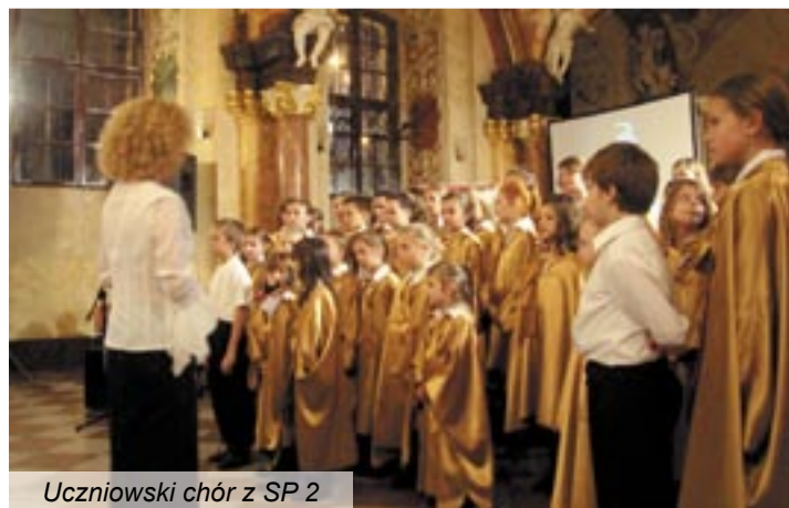
Uczniowski chór z SP 2