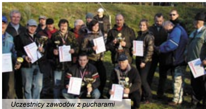
Uczestnicy zawodów z pucharami