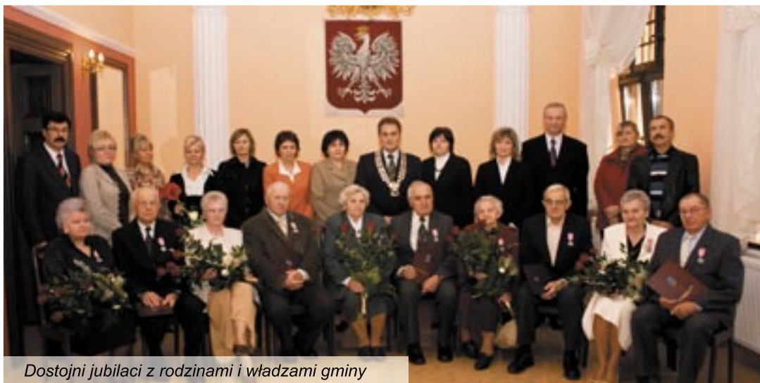
Dostojni jubilaci z rodzinami i władzami gminy