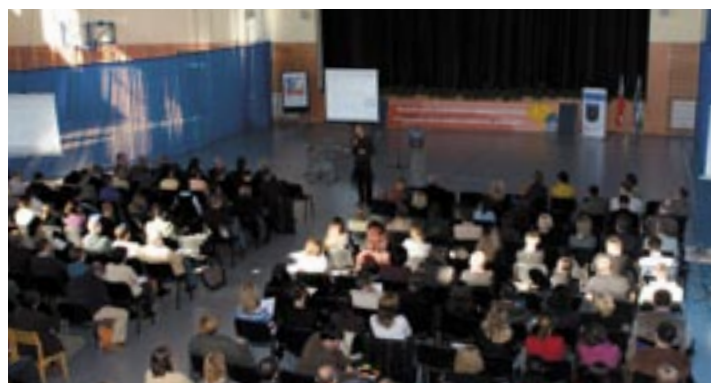
Uczestnicy konferencji mogli podziwiać nową halę

Przewodnym tematem konferencji były zagadnienia związane z administracją szkolnych sieti komputerowych oraz rozwiązywaniem problemów dotyczących jej bieżącej eksploatacji. Zaprezentowane zostały nowe technologie wspomagające pracę administratora, nowe formy i metody wykorzystania technologii informacyjnej w procesie kształcenia, a także przykłady dobrych praktyk w zakresie realizacji projektów unijnych przez szkołę. Tematyka funduszy unijnych znalazła także odzwierciedlenie w warsztatach pn. „Podstawy pisania wniosków o dofinansowanie projektów w ramach Programu Operacyjnego Kapitał