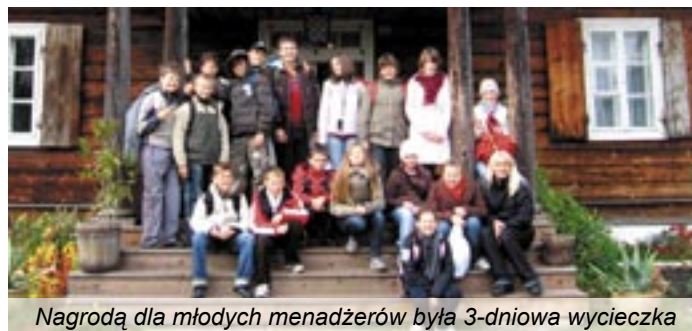
Nagrodą dla młodych menadżerów była 3-dniowa wycieczka