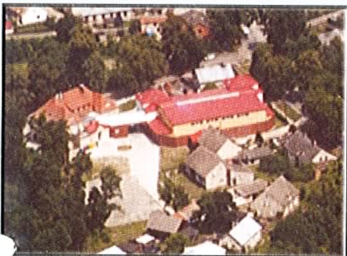
Sala sportowa w Goszczu