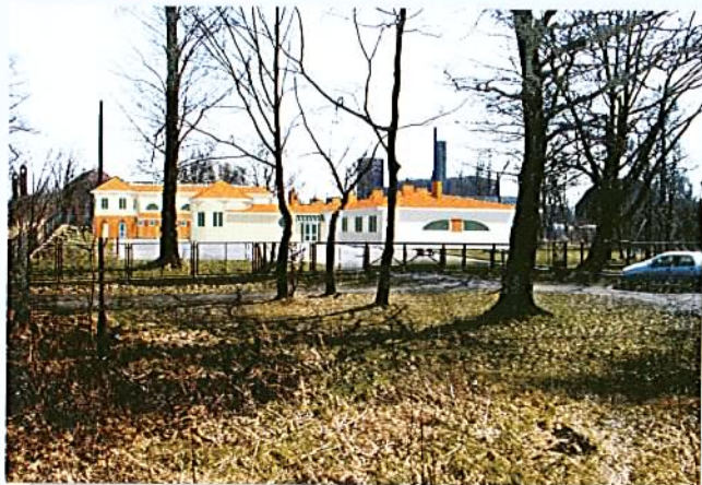
Sala sportowa przy Szkole Podstawowej w Grabownie Wielkim (projekt) termin budowy 2003 rok