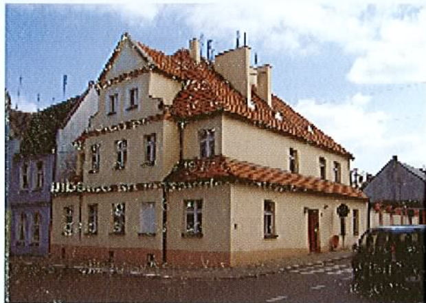
Rynek po remoncie (2002 rok)