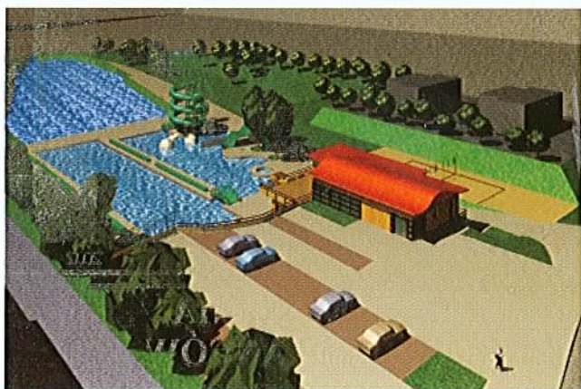
Basen w Twardogórze (projekt) termin budowy - 2003 rok