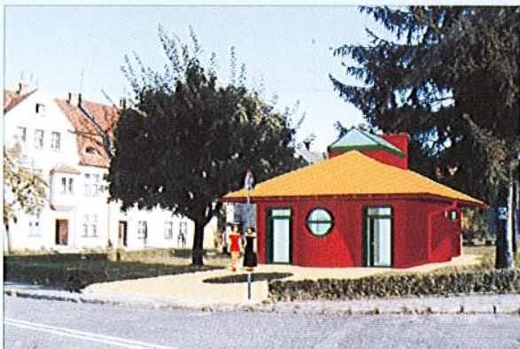
Szalet miejski w Twardogórze - projekt

W związku z opracowaniem projektu budowlano-wykonawczego wolnostojącego szaletu miejskiego o pow. użytkowej 58,78 m 2 w Twardogórze przy u. Wojska Polskiego na działce nr 2 AM 32 Gmina Twardogóra poszukuje osoby fizycznej bądź prawnej, która będzie współinwestorem ww. przedsięwzięcia.