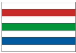
Projekt flagi terytorialnej Gminy Twardogóra