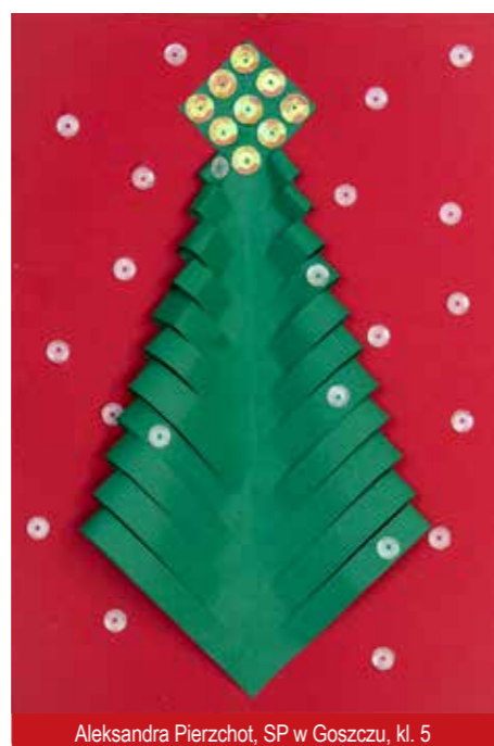
Aleksandra Pierzchot, SP w Goszczu, kl. 5