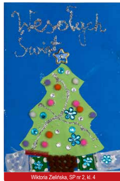
Wiktoria Zielińska, SP nr 2, kl. 4