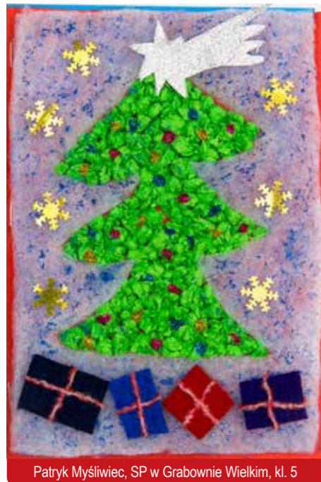
Patryk Myśliwiec, SP w Grabownie Wielkim, kl. 5