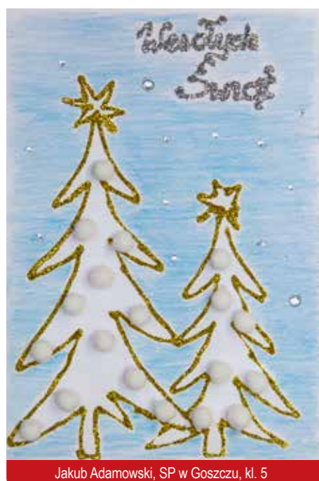
Jakub Adamowski, SP w Goszczu, kl. 5