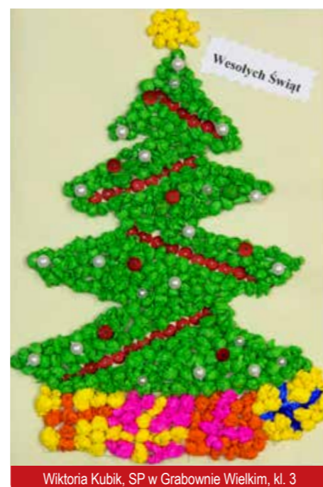
Wiktoria Kubik, SP w Grabownie Wielkim, kl. 3