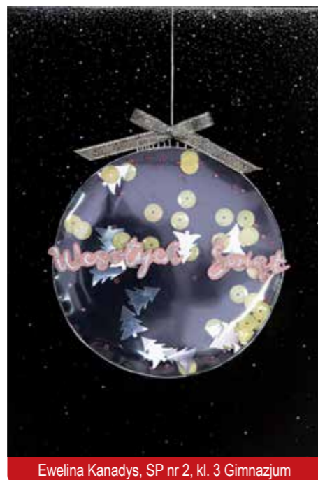
Ewelina Kanadys, SP nr 2, kl. 3 Gimnazjum