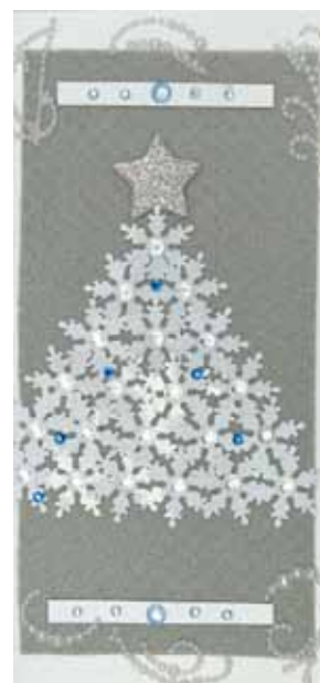
Karolina Gierszon, klasa 6 SP w Goszczu