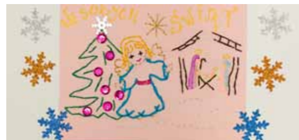
Jagoda Bartecka, klasa 4a SP nr 2 w Twardogórze