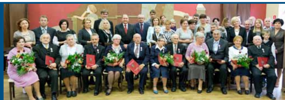
Wnioski o nadanie medali za długoletnie pożycie małżeńskie można składać do Urzędu Stanu Cywilnego w Twardogórze. Informacje pod nr 71 399 22 49.