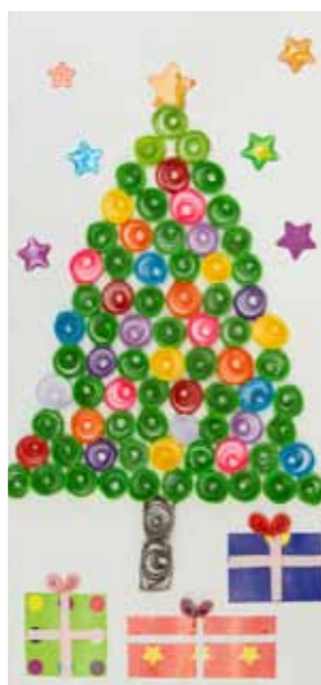
Igor Kniefel, klasa 4a SP nr 1 w Twardogórze