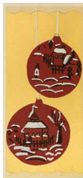
Andres Kinasz, klasa 2b SP nr 1 w Twardogórze