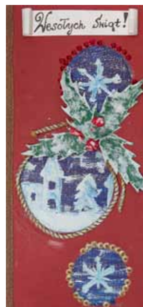
Wiktoria Freus, klasa 6a SP nr 1 w Twardogórze