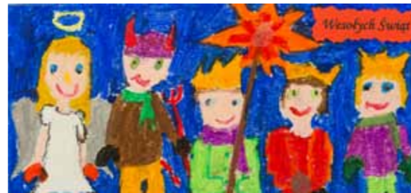
Agata Grzesiak, klasa 6a SP nr 2 w Twardogórze