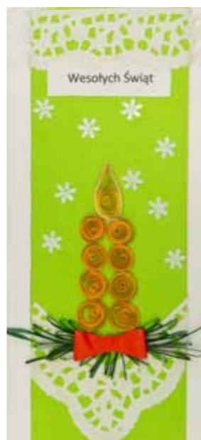
Damian Mateusiak, klasa 4 SP w Goszczu