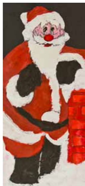
Rafał Oszczygiel, klasa 3 SP nr 3 w Twardogórze