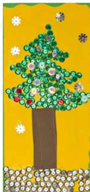
Krystian Górkowy, klasa 3 SP w Grabownie Wielkim