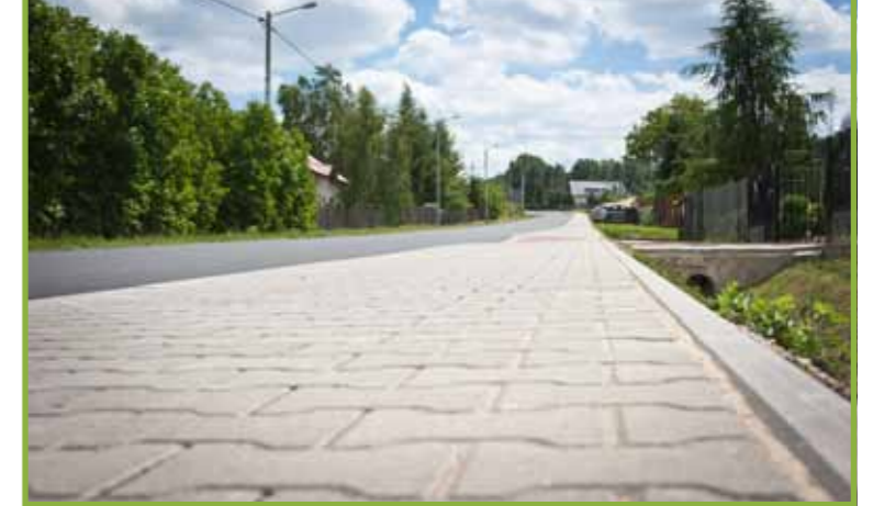
budowa chodnika z Chełstówka do Chełstowa