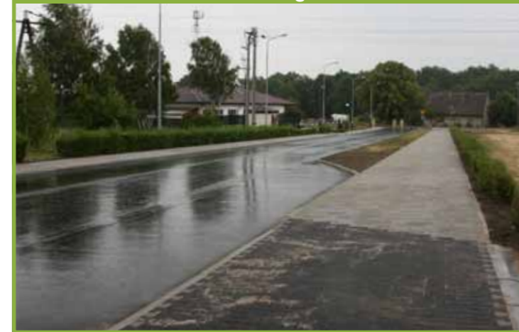
budowa drogi i chodnika na cmentarz