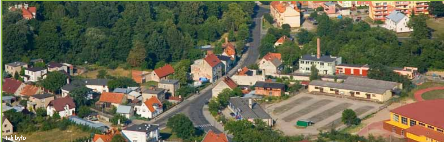
budowa kanalizacji deszczowej, sanitarnej i przyłączy wodociągowych w Moszycach