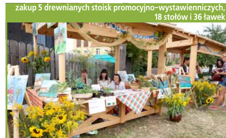
zakup 5 drewnianych stoisk promocyjno-wystawienniczych, 18 stołów i 36 ławek