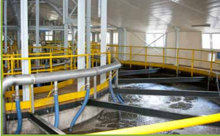
przebudowa miejskiej oczyszczalni ścieków