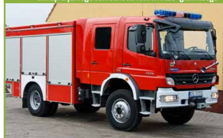
zakup ciężkiego samochodu ratowniczo-gaśniczego