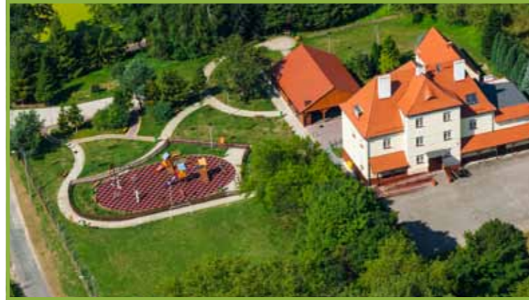
zagospodarowanie terenu wokół Centrum Inicjatyw Wiejskich w Chełstowie