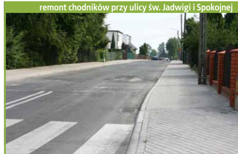
remont chodników przy ulicy św. Jadwigi i Spokojnej