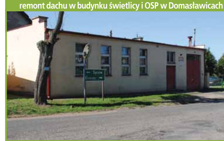
remont dachu w budynku świetlicy i OSP w Domasławicach