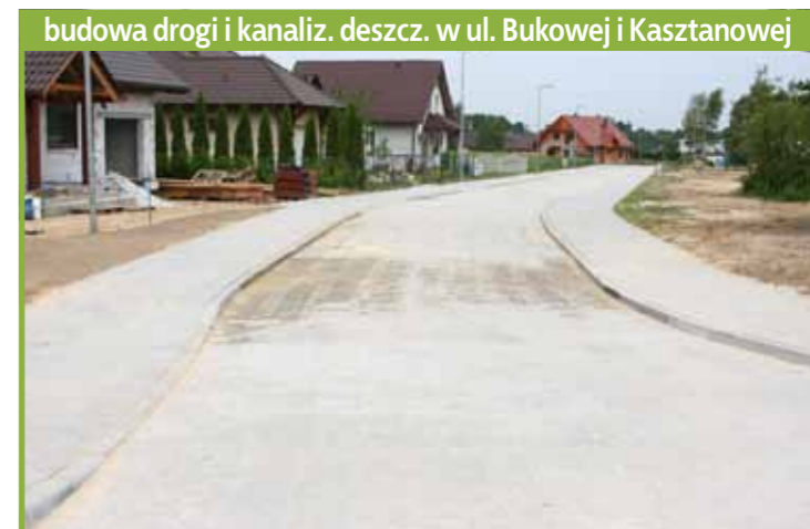
budowa drogi i kanaliz. deszcz. w ul. Bukowej i Kasztanowej