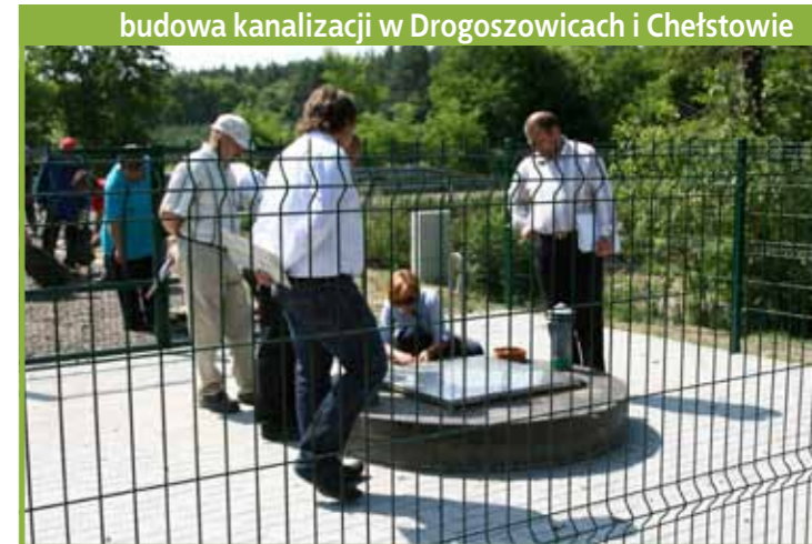
budowa kanalizacji w Drogoszowicach i Chełstowie