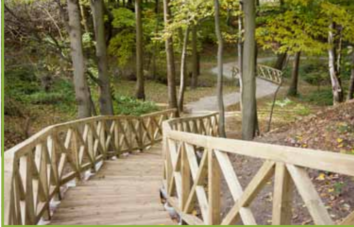
budowa ścieżki przyrodniczo-edukacyjnej