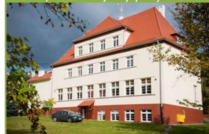
przebudowa budynku byłej szkoły w Chełstowie