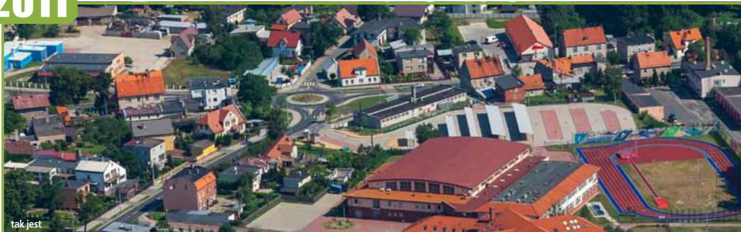
przebudowa ulicy Wrocławskiej od skrzyżowania z ulicą Sosnową i Leśną wraz z budową ronda