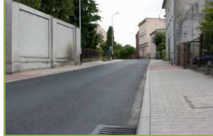
remont ulicy Długiej