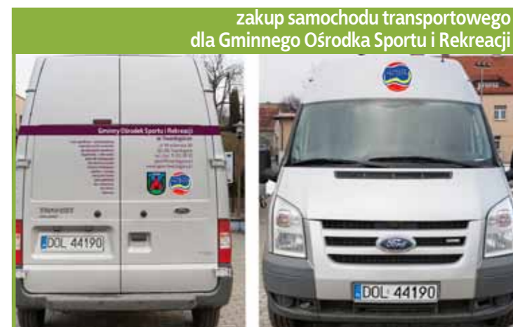
zakup samochodu transportowego dla Gminnego Ośrodka Sportu i Rekreacji