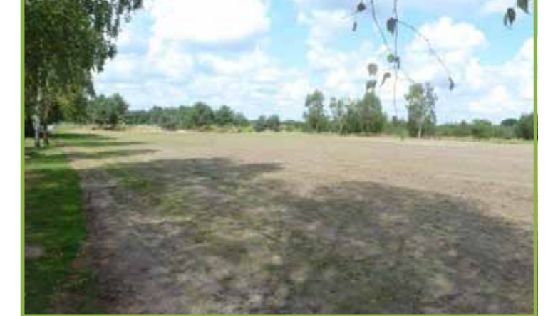
remont boiska w Bukowiniec