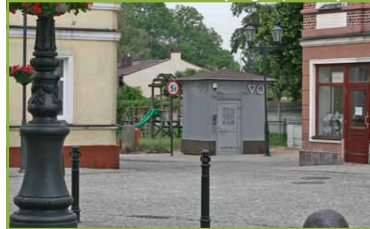
uruchomienie szaletu miejskiego w pobliżu Rynku