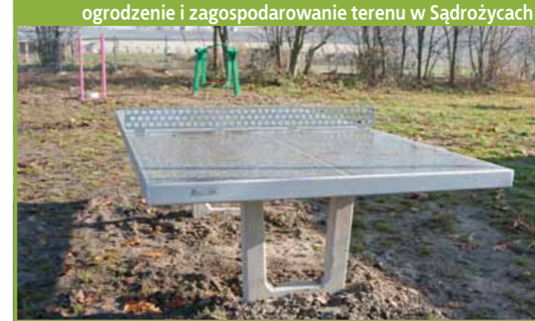
ogrodzenie i zagospodarowanie terenu w Sądrożycach