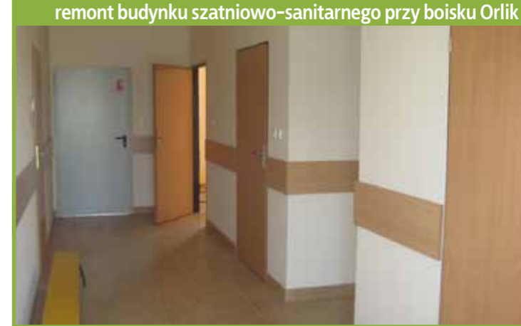
remont budynku szatniowo-sanitarnego przy boisku Orlik