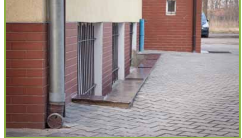
odwodnienie terenu przy szkole w Goszczu