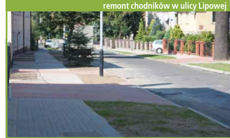
remont chodników w ulicy Lipowej