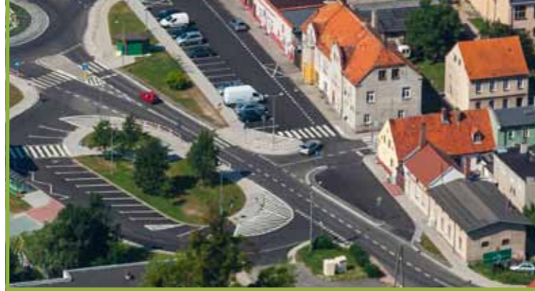
drugi etap przebudowy skrzyżowania ulic Wojska Polskiego, 1-go Maja, Poznańskiej i Pl. Targowego