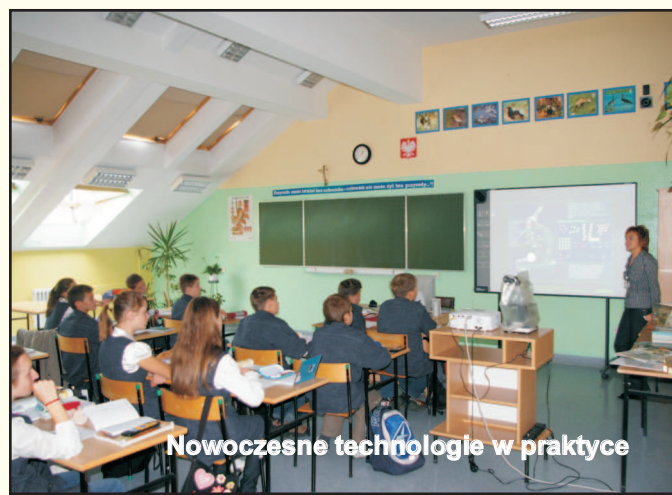
Nowoczesne technologie w praktyce