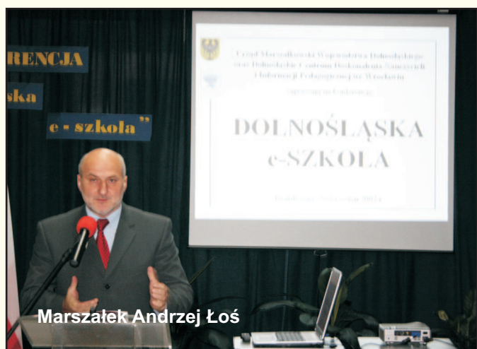
Marszałek Andrzej Łoś