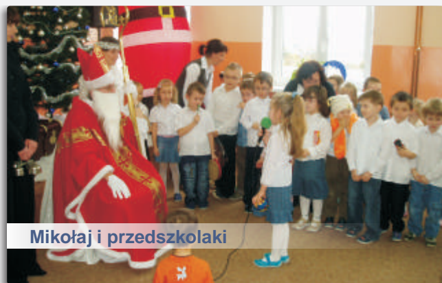
Mikołaj i przedszkolaki