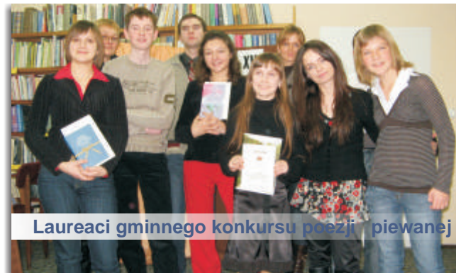
Laureaci gminnego konkursu poezji i piewanej