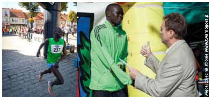
więcej zdjęć na stronie www.twardogora.pl

Na 18. Międzynarodowym Biegu Ulicznym o Puchar Przewodniczącego Rady Miejskiej nie było niespodzianek. Zarówno w kategorii kobiet, jak i mężczyzn czołowe miejsca zajmowali Kenijczycy. Najszybszy z nich