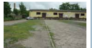
Targowisko przed przebudową