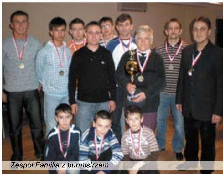
Zespół Familia z burmistrzem