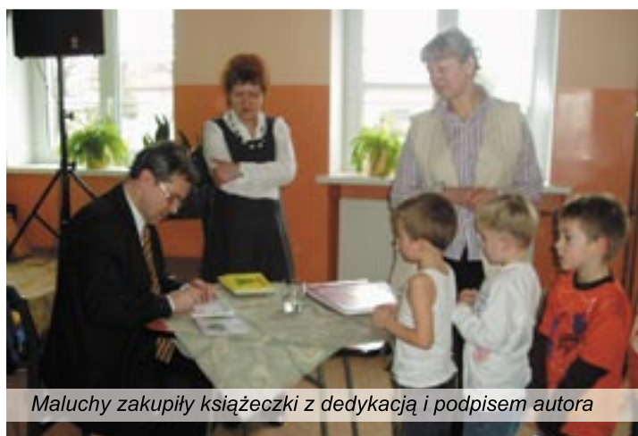
Maluchy zakupiły książeczki z dedykacją i podpisem autora

wyróżnienie Zespół Wokalny (Oleśnica) Laureaci pierwszych miejsc otrzymali odtwarzacze DVD ufundowane przez Burmistrza Miasta i Gminy Twardogóra. Organizatorzy składają podziękowania pozostałym sponsorom.