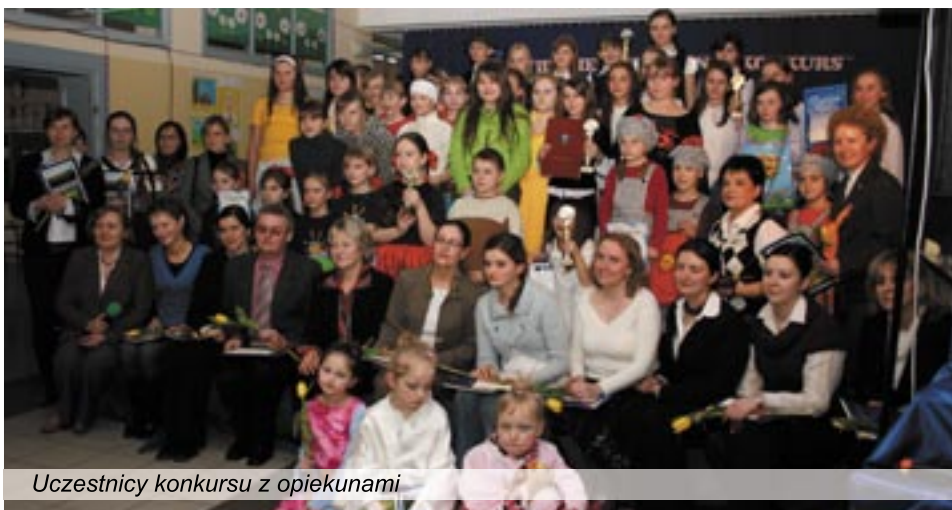
Uczestnicy konkursu z opiekunami