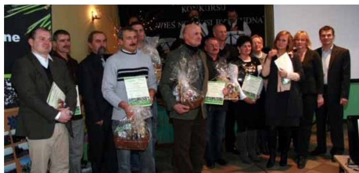
Wyróżnieni reprezentanci sołectw

zgłosiły się dwa sołectwa: Chelstów oraz Moszyce. Od marca do listopada ubiegłego roku sołectwa te prowadziły swoją stronę internetową www.aktywni.barycz.pl , gdzie na bieżąco mogły się chwalić swoimi osiągnięciami. Chelstów promował park, powstającą świetlicę, imprezy integracyjne, a w szczególności odpust św. Idziego. Moszyce natomiast promowały nową świetlicę. Laureatem I miejsca zostały Przygodziczki. Podczas gali gminę Twardogóra repre-