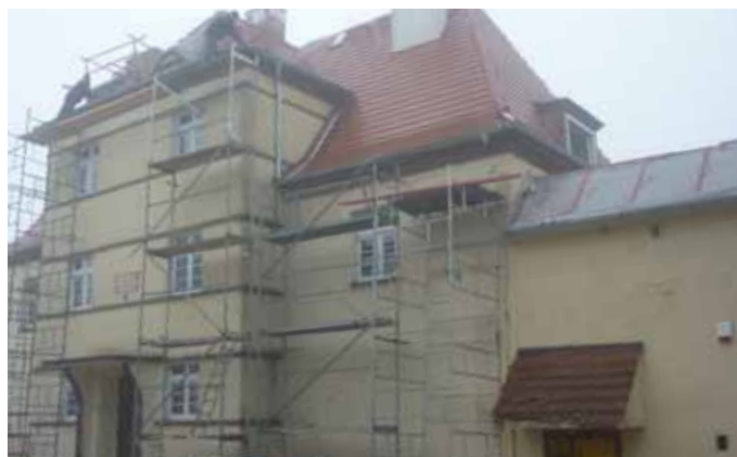
Budynek byłej szkoły w Chełstowie