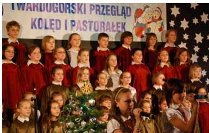
80 wykonawców wzięło udział w tegorocznym przeglądzie