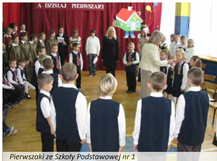
Pierwszaki ze Szkoły Podstawowej nr 1

w Szkole Podstawowej nr 1. Dzieci - żółtodzioby, poprowadzone przez dobrą wróżkę przez różne krainy, udowodniły, że są gotowe, by stać w szeregach uczniów. Po ślubowaniu i pasowaniu przez dyrektorkę Marię Lidię Gerus otrzymały upominki od szóstoklasistów i wielki tort z logo szkoły od dyrektorki.