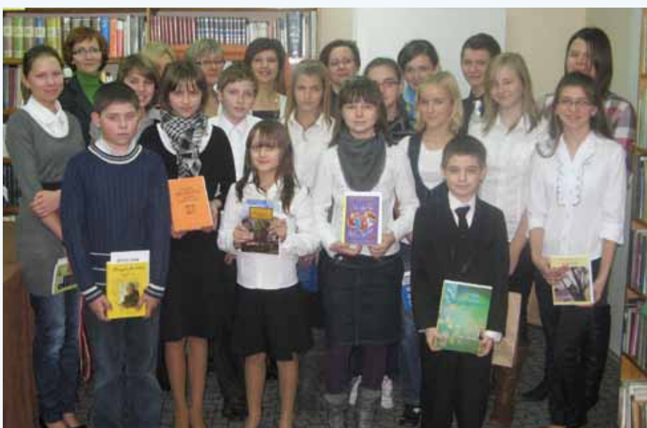
...oraz Gminnego Konkursu Recytatorskiego