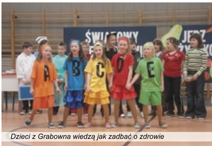
Dzieci z Grabowna wiedzą jak zadbać o zdrowie