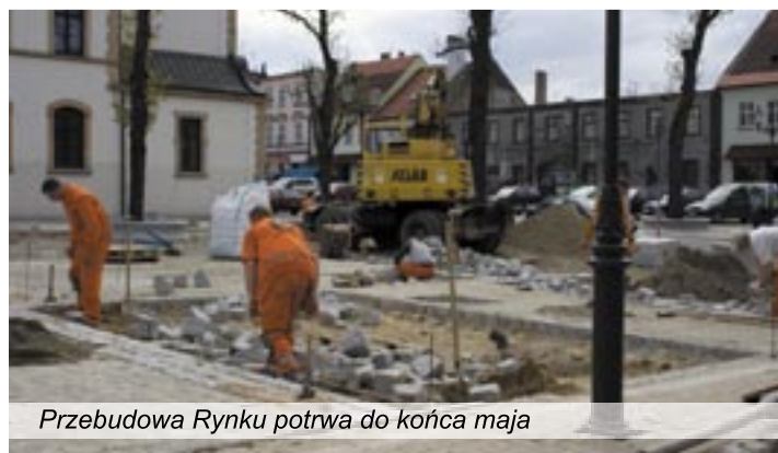
Przebudowa Rynku potrwa do końca maja

Dobiegają także końca prace przy ciągu pieszym między ulicami Długa i B. Krzywoustego. Teraz kolej na chodniki w ulicy Ks. H. Wiernego i przy Grzybowej.