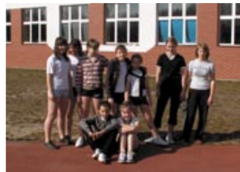
Młodzi sportowcy po testach sprawnościowych

W ramach realizacji części projektu „Trzymaj formę” szkoła zorganizowała Dzień Sportu. Organizatorami mi-