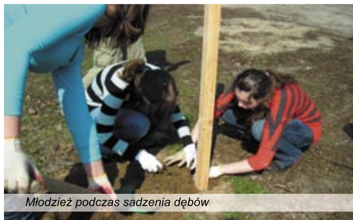
Młodzież podczas sadzenia dębów