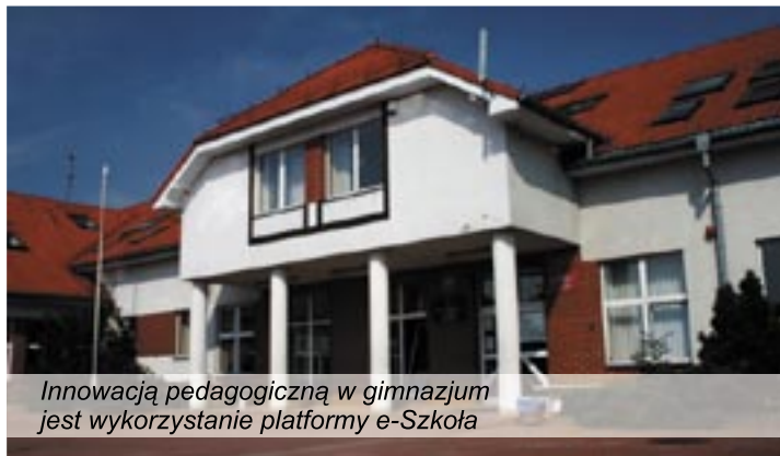
Innowacją pedagogiczną w gimnazjum jest wykorzystanie platformy e-Szkoła

Kuratorium Oświaty we Wrocławiu przeprowadziło wizytację w Gimnazjum nr 1 w Twardogórze. Z protokołu powizytacyjnego, przedłożonego w marcu burmistrzowi, wynika, że szkoła dysponuje bazą lokalową i wyposażeniem zapewniającym właściwą organizację procesu edukacyjnego. Sale, w których uczą się dzieci, są wyposażone w środki dydaktyczne niezbędne do realizacji obowiązujących w szkole programów nauczania. Or-