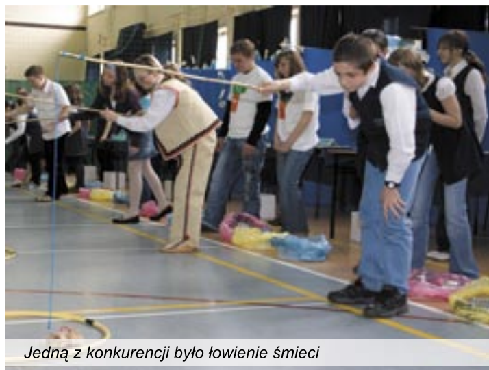
Jedną z konkurencji było łowienie śmieci