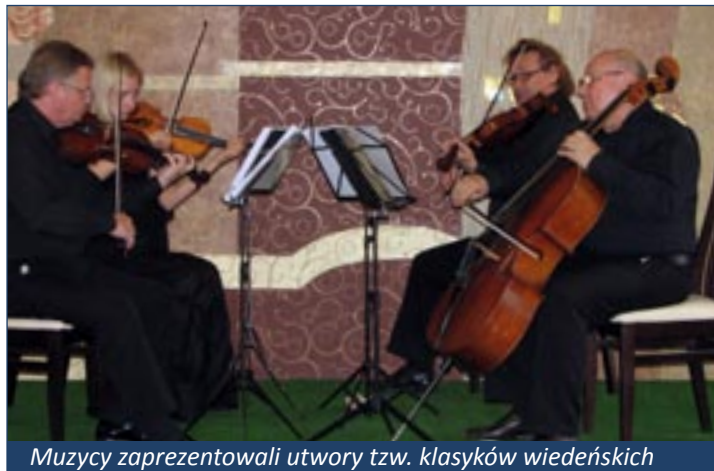
Muzycy zaprezentowali utwory tzw. klasyków wiedeńskich