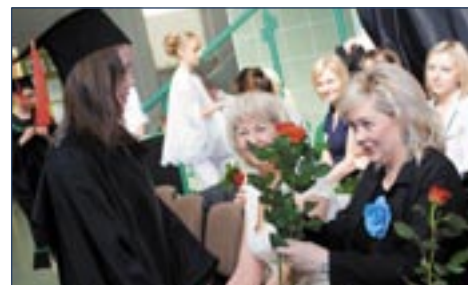
Szkoła Podstawowa w Goszczu