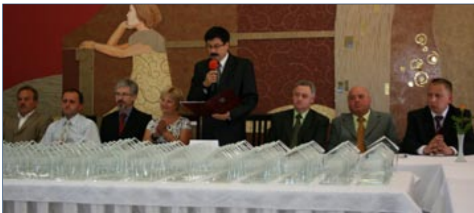
41. Sesja Rady Miejskiej odbyła się w świetlicy w Moszycach

Niewiele w Polsce gmin wielkością zbliżonych do Twardogóry może się pochwalić tak dużą dynamiką inwestycyjną i ilością środków pozyskanych z zewnątrz. Dorobek ostatnich dwóch dekad jest więc godny pozazdroszczenia - o czym można się było przekonać 17 czerwca w Moszycach, podczas 41. uroczystej sesji rady miejskiej, zwołanej z okazji 20-lecia istnienia gminnych samorządów. Oprócz obecnych władz gminy, przybyli na nią radni minionych czterech kadencji, byli burmistrzowie, kierownicy referatów urzędu, dyrektorzy oraz kierownicy gminnych jednostek organizacyjnych, właściciele, prezesi i dyrektorzy wielu przedsiębiorstw, sołtysi, a także miejscowi księża. Oczywiście byli też ci, którzy nieprzerwanie od 20 lat pełnią