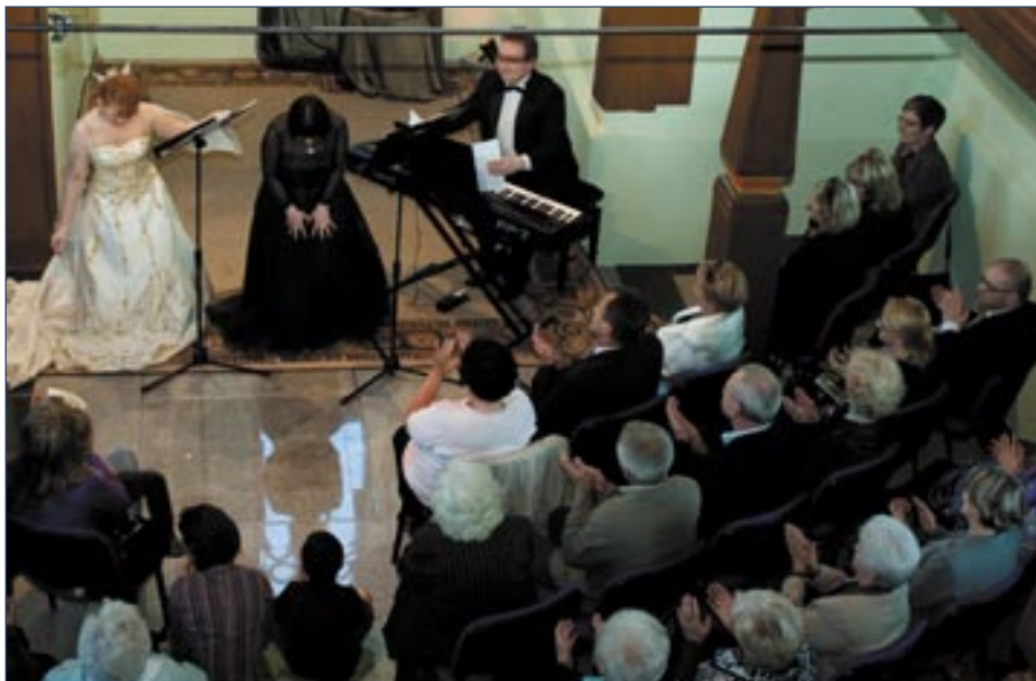
Głównym organizatorem koncertu było nowo powstałe stowarzyszenie VIVA ART

Kościółek pw. św. Trójcy znów zaczął tętnić życiem, a ściślej mówiąc – muzyką przez duże „M”. 4 czerwca w tej odrestaurowanej świątyni zabrzmiał Fryderyk Chopin. Wszystko to zasługa naszego samorządu oraz nowo powstałego stowarzyszenia Viva-Art, które otrzymało od gminy dotację w wysokości 9 900 zł i które było głównym organizatorem piątkowego koncertu „Chopin w dwóch kolorach”. Pomagał Gminny Ośrodek Sportu i Rekreacji. W ten wzniosły sposób gmina Twardogóra włączyła się w obchody 200. rocznicy urodzin Fryderyka Chopina, znakomitego polskiego kompozytora i pianisty. Melomanów przybyło tak wiele, że w kościółku z trudem można było znaleźć choć jedno wolne miejsce. – Wielkim naszym marzeniem było, aby Dni Twardogóry rozpoczęły się wydarzeniem kulturalnym, którego jeszcze u nas nie