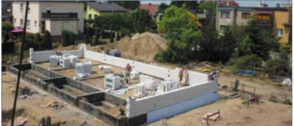
Widać już zarys sali gimnastycznej przy SP 1. Konsorcjum „Michalski” z Leszna zakończyło prace ziemne, wykonało przyłącza sanitarne oraz fundamenty. Rozpoczęto budowę ścian. Koszt inwestycji to 3 578 435,95 zł. Zakończenie budowy przewidziane jest do marca przyszłego roku.