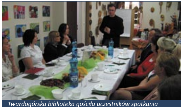
Twardogórska biblioteka gościła uczestników spotkania