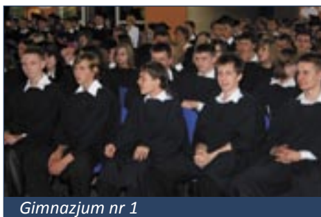
Gimnazjum nr 1

Gminna średnia, jeżeli chodzi o wyniki sprawdzianów na zakończenie nauki w naszych szkołach podstawowych, wyniosła w tym roku 22,8. Średnia powiatowa to 24,5, wojewódzka – 24,3, a krajowa – 24,6. Tak samo jak rok temu, najlepiej w gminie Twardogóra sprawdzian napisali uczniowie SP nr 2, uzyskując średnią 23,8. Wynik SP w Grabownie Wielkim to 23,7, SP nr 1 – 22,5, SP Goszcz – 21.