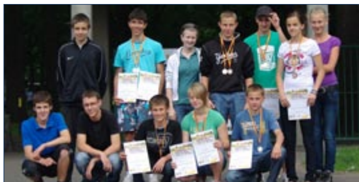
Twardogórskie Echo może pochwalić się wieloma sukcesami