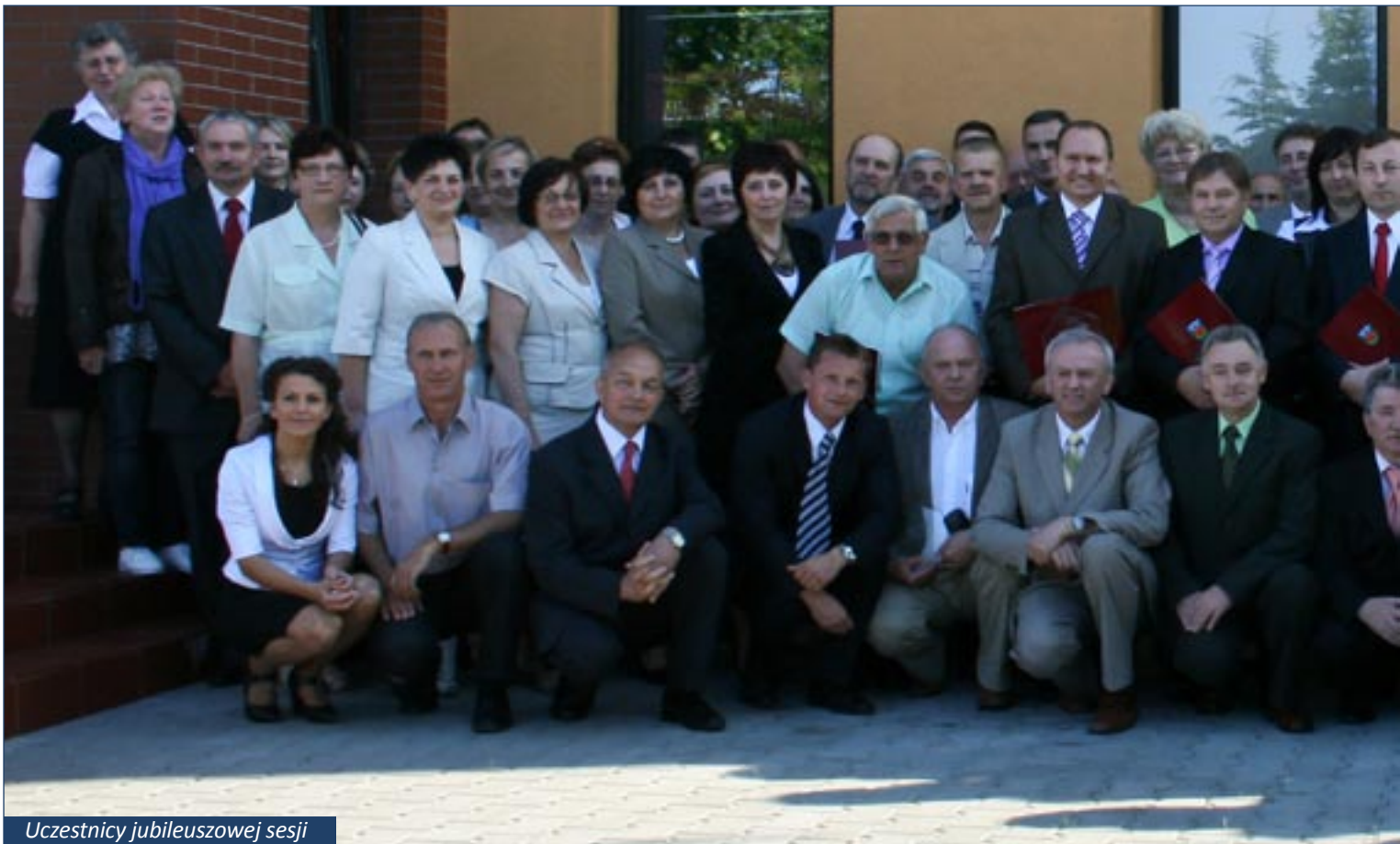
Uczestnicy jubileuszowej sesji