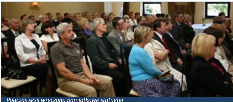
Podczas sesji wręczono pamiątkowe statuetki

12.01: rada podejmuje uchwałę w sprawie budowy szkoły podstawowej w Twardogórze przy ul. Batorego. W głosowaniu imiennym 17 radnych jest za,