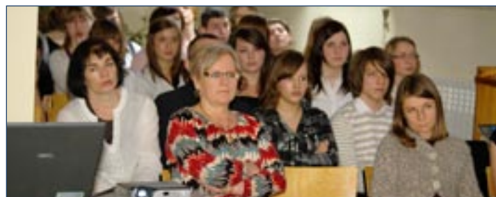
W tegorocznej edycji konkursu wzięło udział 6 szkół