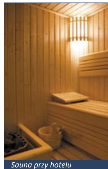
Sauna przy hotelu