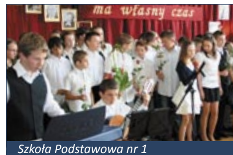
Szkoła Podstawowa nr 1