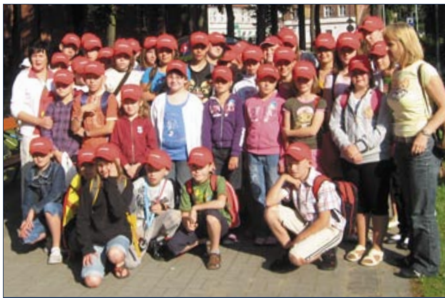
Przed wyjazdem do Mrzeżyna

Już po raz dziesiąty dzieci w wieku od 8 do 15 lat z gminy Twardogóra wyjechały na dwutygodniowe kolonie. 40-osobowa grupa wycieczka w ośrodku kolonijnowo-wczasowym w Mrzeżynie od 26 czerwca. Wyjazd został zorganizowany i sfinansowany przez gminę, która przeznaczyła na ten cel 29 520 zł. Także Caritas Parafialny zorganizował dzieciom kolonie w Przedborowie od 14. do 21 lipca. Gmina opłaci im przejazd w dwie strony. Wyjedzie 36 osób. Kolejnych 10 młodych mieszkańców naszej gminy będzie wycieczka w Pustkowie koło Rewala. Organizator tego wyjazdu, czyli kuratorium oświaty, przyznało Twardogórze 10 miejsc i za pośrednictwem Miejsko-Gminnego Ośrodka Pomocy Społecznej wytypowało osoby do wyjazdu w dniach 6-19 lipca. Gmina zapłaci za dojazd do miejsca zbiórki w Miliczu.