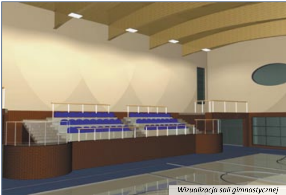
Wizualizacja sali gimnastycznej

22 marca została podpisana umowa z Konsorcjum „Michalski” z Leszna, które wybuduje salę gimnastyczną przy Szkole Podstawowej nr 1 przy ul. Św. Jadwigi 7 w Twardogórze. Dwa dni później wykonawcy zostali przekazani plac budowy. Budowa rozpocznie się w połowie kwietnia. Inwestycja pochłonie 3 578 435,95 zł z gminnego budżetu. Zgodnie z umową, firma ma rok na wybudowanie sali. Nadzór inwestorski nad budową sali będzie pełniła firma ALTER Obsługa Inwestycji Budowlanych ze Spalic za 29 280 zł. Zakres konstrukcyjno-budowlany nadzorować będzie Remigiusz Śliwka, sanitarny - Halina Roszak, a elektryczny Marcin Bernacki.