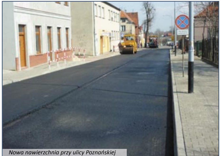
Nowa nawierzchnia przy ulicy Poznańskiej