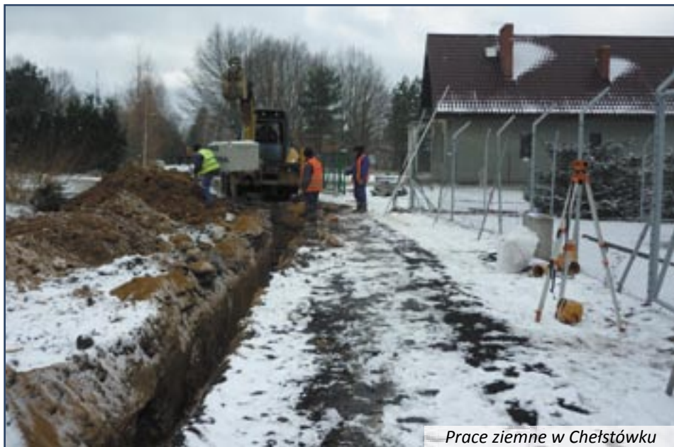
Prace ziemne w Chełstówku