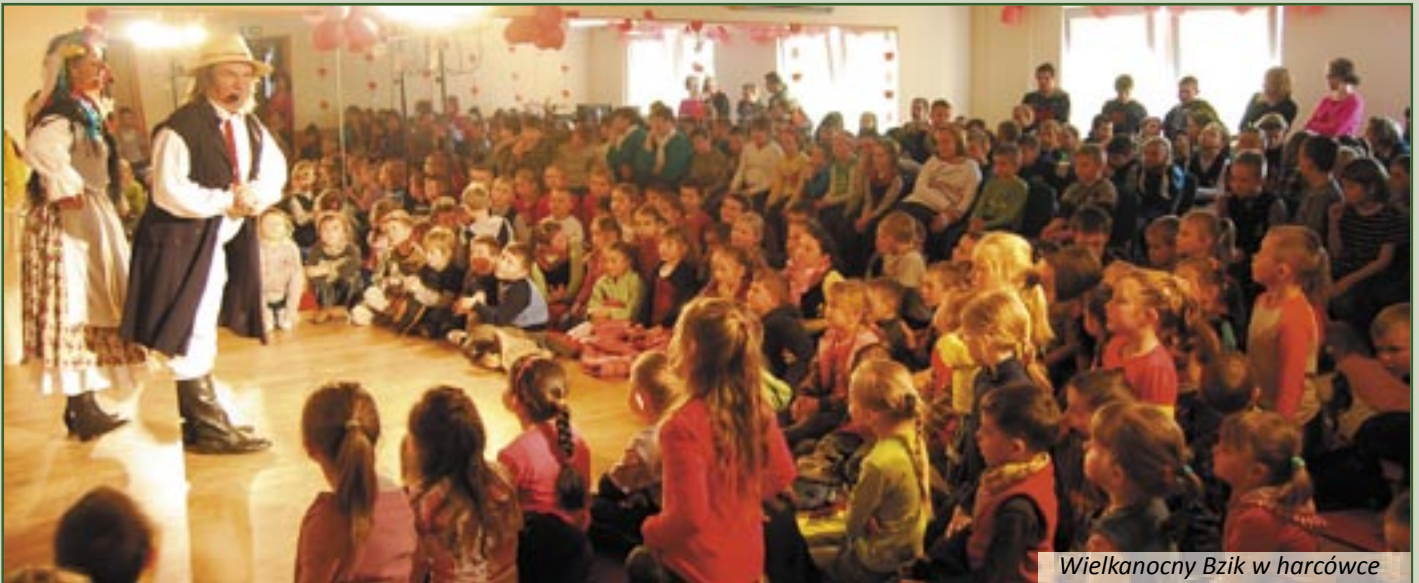
Wielkanocny Bzik w harcówce