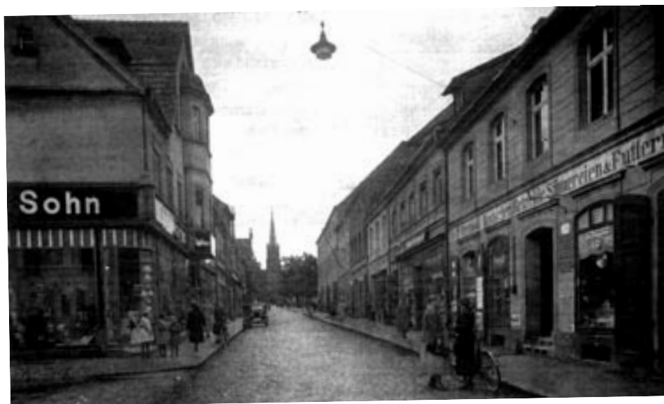
Twardogóra na starej fotografii

Wstęp od 23 kwietnia (pt); bilety: 25 zł/dzień, 15 zł - ulgowy (dzieci, młodzież ucząca się, emeryci/renciści), karnet na 3 dni - 50 zł i 30 zł. Do 22 kwietnia bilety w cenie 5 (normalny) i 3 zł (ulgowy).