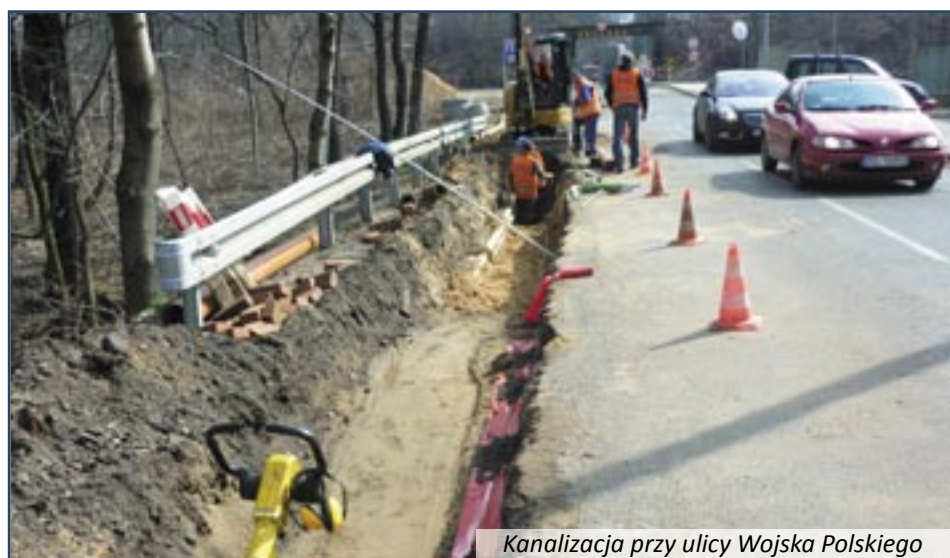
Kanalizacja przy ulicy Wojska Polskiego