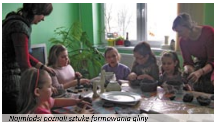
Najmłodszy poznali sztukę formowania gliny