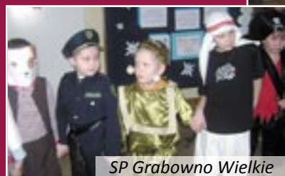
SP Grabowo Wielkie

bawili się rycerze, czarownice, królowny, piraci, muskietierowie i inne bajkowe postacie. W przerwach tancerze delectowali się przygotowanymi przez rodziców łakociami.