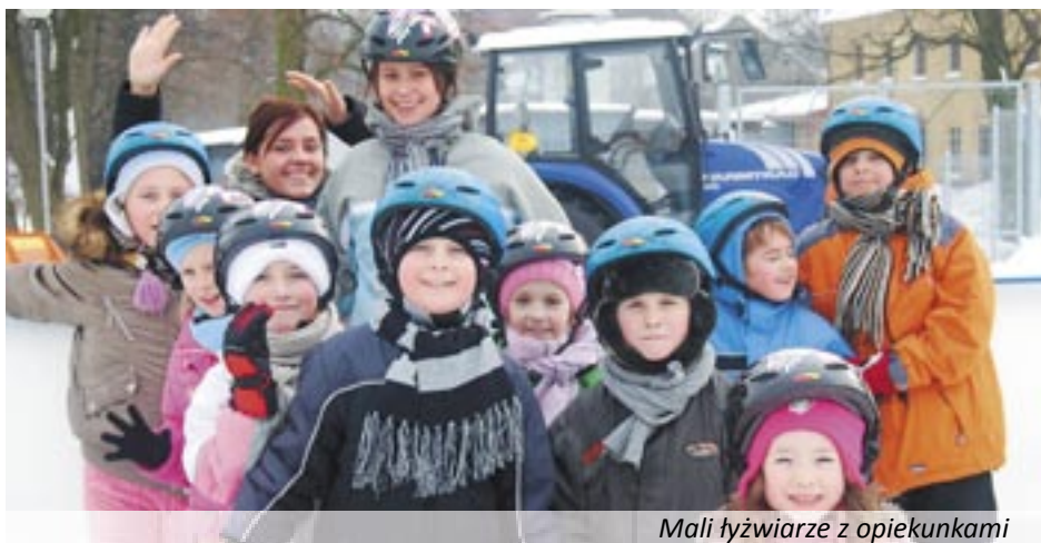
Mali łyżwiarze z opiekunkami