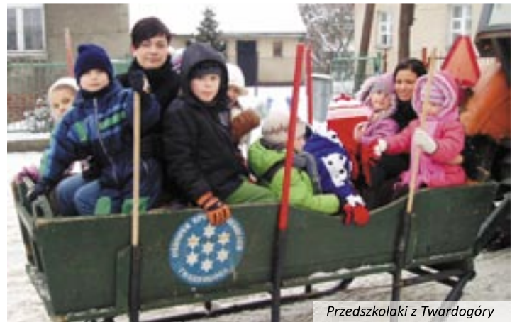
Przedzkolaki z Twardogóry

tarli szlak kuligu oraz przygotowali wspaniałe ognisko. Po tych śnieżnych wycieczkach, trochę zmarznięci, obasypani śniegiem, ogrzali się przy ognisku, pijąc gorącą herbatę i jedząc pieczone kiełbaski przygotowane przez mamy maluchów. Wszyscy się przekonali, że zima jest piękna, a wspólne zabawy integrują nie tylko dzieci, ale i rodziców.