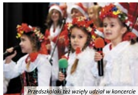
Przedszkolaki też wzięły udział w koncercie

przez Klub Młodego Odkrywcy, kącik ozdabiania balonów, malowania twarzy, kolorowych prasowanek. Otwarto też kawiarenkę, w której można było skosztować pysznych wypieków, przygotowanych przez rodziców gimnazjalistów. VII Koncert Bożonarodzeniowy uświetnił występ małych aktorów i tancerzy z Miejskiego Przedszkola w Twardogórze z Oddziałem Małego Dziecka. Popisy maluchów wzbudziły duży aplauz widowni. Równie ciepło zostali przyjęci uczniowie Społecznego