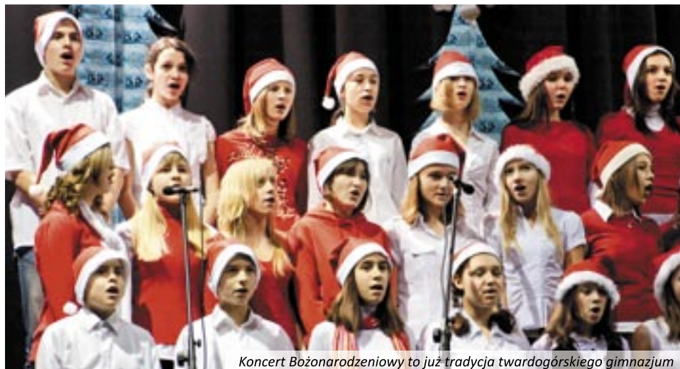
Koncert Bożonarodzeniowy to już tradycja twardogórskiego gimnazjum

Ogniska Artystycznego „Allegretto”, którzy wykonali nastrojowe: „Przeżamy sobie znak pokoju” oraz „Przybieżeli do Betlejem”. Kolejnym punktem programu był występ gimnazjalnego chóru, który brawurowo wykonał kilka pastorałek i świątecznych piosenek. Goście byli również pod wrażeniem tanecznych popisów gimnazjalnej młodzieży. Dziewczęta i chłopcy, przebrani za anioły i diabły, zaprezentowali odwieczną walkę dobra i zła. Duże oklaski dostali również tańczący św. Mikołajowie. Oczywiście nie mogło zabraknąć jasełek. Współczesna historia narodzenia Bożej Dzieciny rozbawiła zebranych, ale i wprowadziła w refleksyjny nastrój. Mimo zimowej aury, szczytny cel wyzwolił w dzieciach i dorosłych najcieplejsze uczucia. Przybyli goście okazali wielkie serce i hojność jeszcze większą, niż w poprzednich latach.