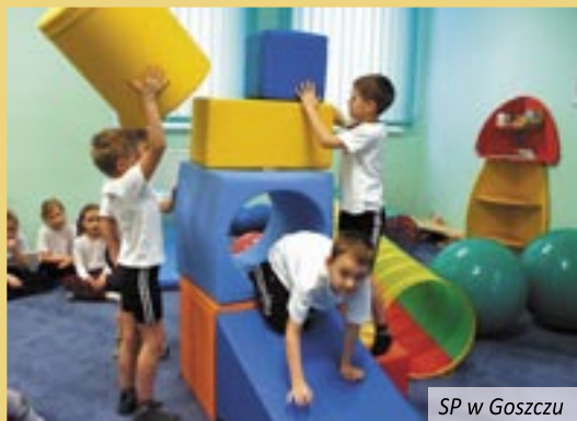
SP w Goszczu

wpływające pozytywnie na kształtowanie psychomotoryki, pamięci, charakteru i umiejętności społecznych. Pomieszczenie zostało też wyposażone w drabinki (na ścianie) oraz w suchy basen z piłeczkami. Miejsca takie posiadają także SP 1 i SP 2 w Twardogórze oraz SP w Goszczu. Szkoły utworzyły miejsca zabaw dzięki środkom finansowym pozyskanym przez gminę w wysokości 42 tys. zł z rządowego programu „Radosna szkoła”.