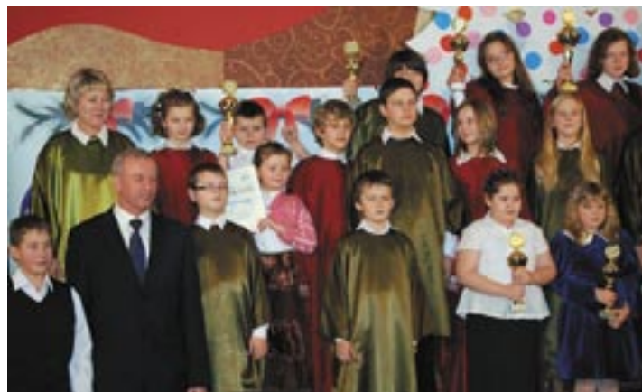
Przeegląd kołęd odbył się w nowowymontowanej świetlicy w Moszycach