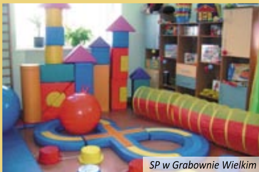
SP w Grabownie Wielkim