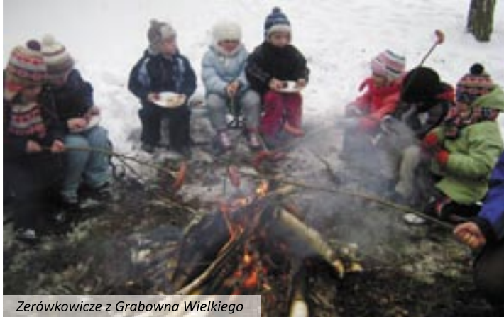
Zerótkowicze z Grabowna Wielkiego

Dzieci uwielbiają zimę i zabawy na śniegu, dlatego miały okazję wziąć udział w kuligach. Tym bardziej, że styczeń temu sprzyjał w najlepsze. 7 i 8 stycznia przejażdżki saniami zasmakowały przedszkolaki. Sanna była „pyszna”, a dla niektórych dzieci był to pierwszy kulig w życiu. Pod czujną opieką nauczycielek i pań oddziałowych, saniami zwiędziły oko-