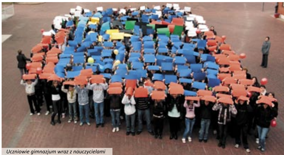
Uczniowie gimnazjum wraz z nauczycielami

26 listopada na szkolny dziedzińiec wyszli wszyscy uczniowie (blisko 500 młodych ludzi) i nauczy-