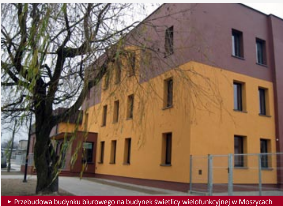
► Przebudowa budynku biurowego na budynek świetlicy wielofunkcyjnej w Moszycach