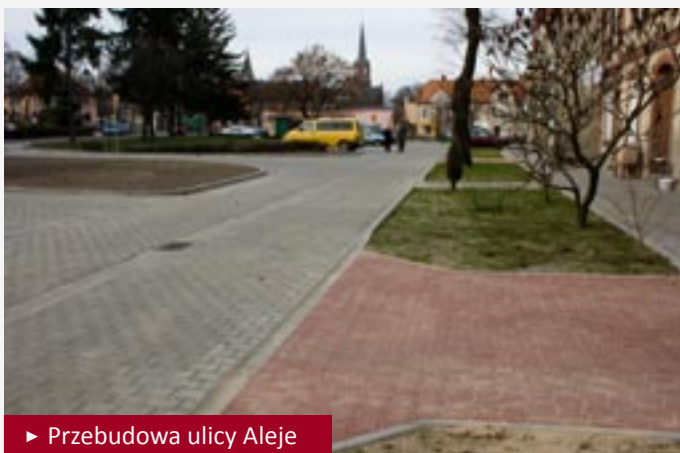
► Przebudowa ulicy Aleje