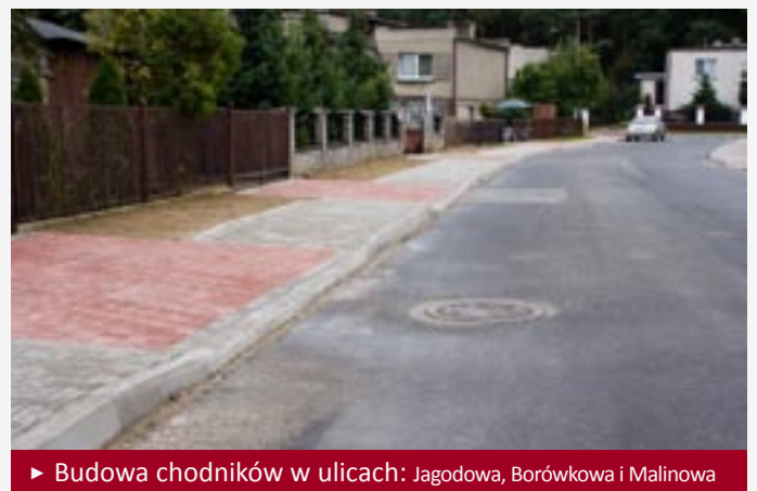
► Budowa chodników w ulicach: Jagodowa, Borówkowa i Malinowa