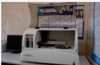
► Zakup aparatu biochemicznego do laboratorium analitycznego w SZPZOZ