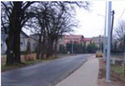
► Budowa oświetlenia drogowego w Moszycach