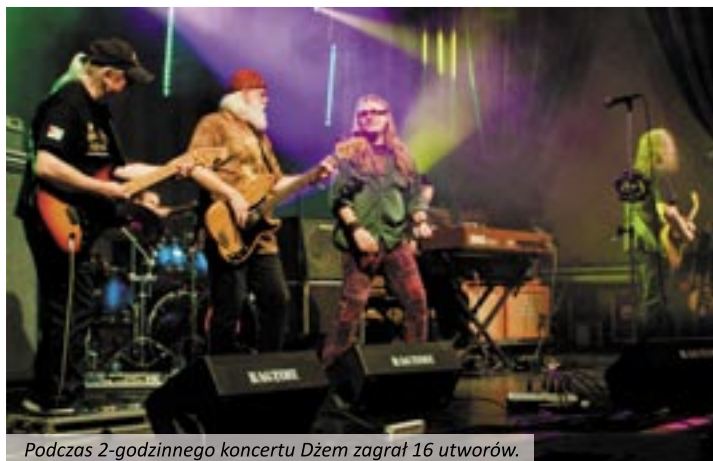
Podczas 2-godzinnego koncertu Dżem zagrał 16 utworów.

Po siedmiu latach znów przyjechali do naszego miasta i znów, jak na Dniach Twardogóry z 2002 roku, zagraли ostro i z pazurem. Ale nic w tym dziwnego, wszak „Dżem”, to jeden z najlepszych polskich zespołów, prawdziwa legenda mierzona nie tyle liczbą sprzedanych płyt, co ilością wiernych fanów, trwających przy formacji niezależnie od aktualnych mód. Było to widoczne 13 grudnia w hali sportowo-widowiskowej przy ul. Wrocławskiej, gdzie zespół oklaskiwały trzy pokolenia wielbicieli – ci grubo po pięćdziesiątce, ich dzieci, ale i kil-