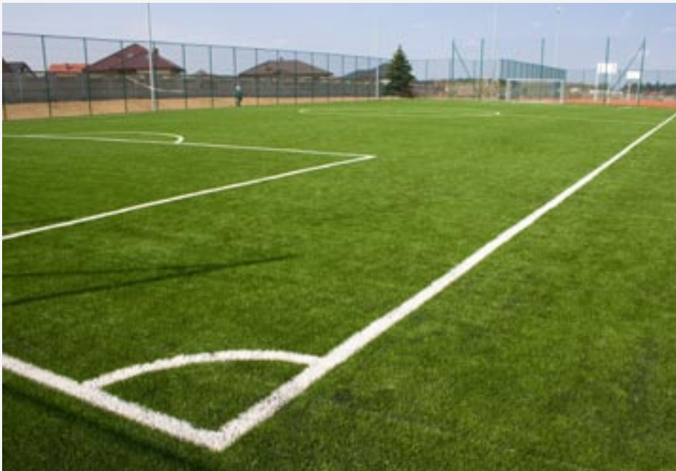
► Budowa kompleksu boisk sportowych w ramach projektu „Moje Boisko ORLIK 2012”