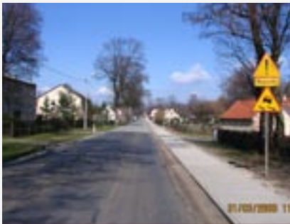
► Budowa chodników w Goszczu