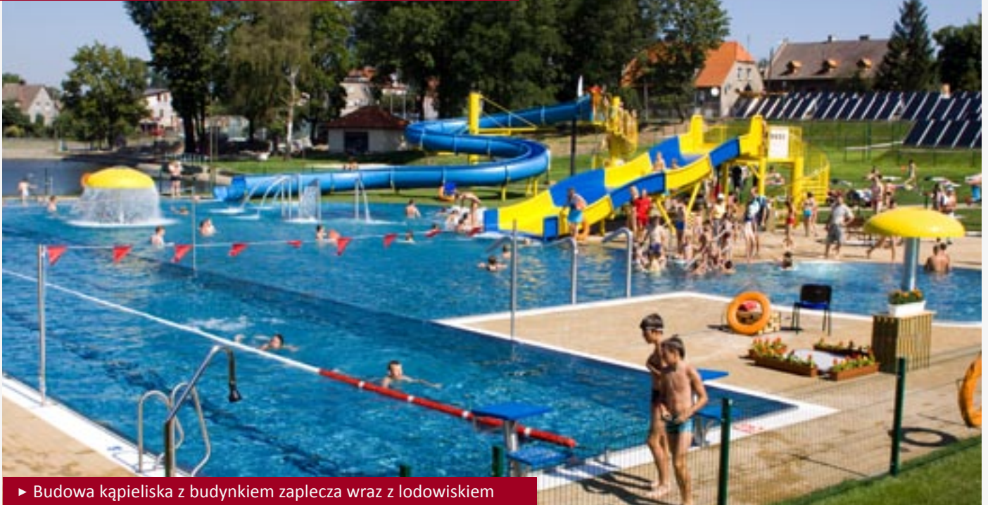
► Budowa kąpieliska z budynkiem zaplecza wraz z lodowiskiem