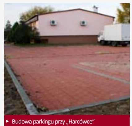
► Budowa parkingu przy „Harcówce”