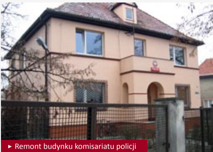
► Remont budynku komisariatu policji