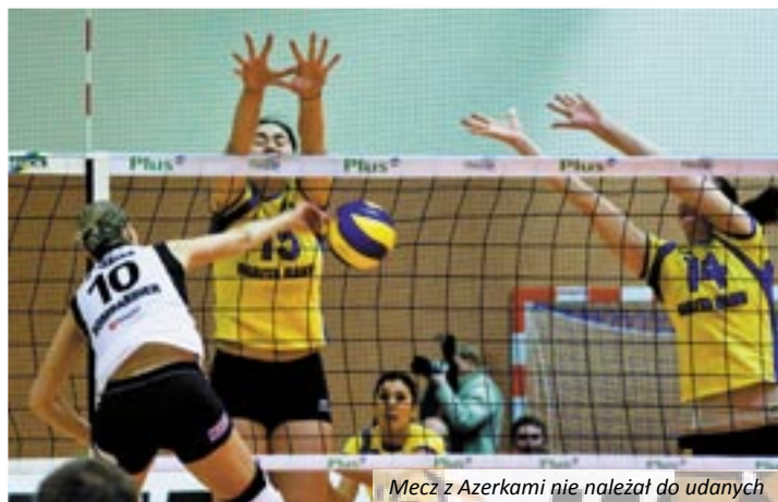
Mecz z Azerkami nie należał do udanych