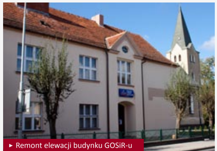
► Remont elewacji budynku GOSiR-u