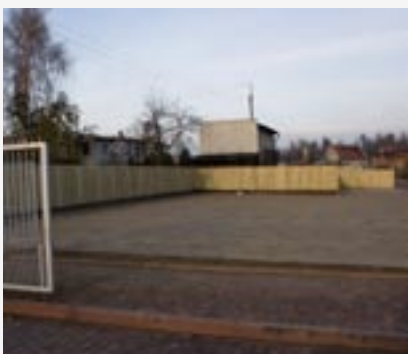
► Budowa parkingu przy hali sportowo-widowisk.