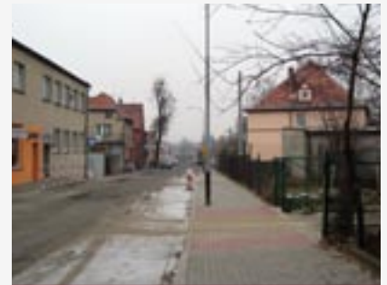
► Przebudowa ulicy Poznańskiej