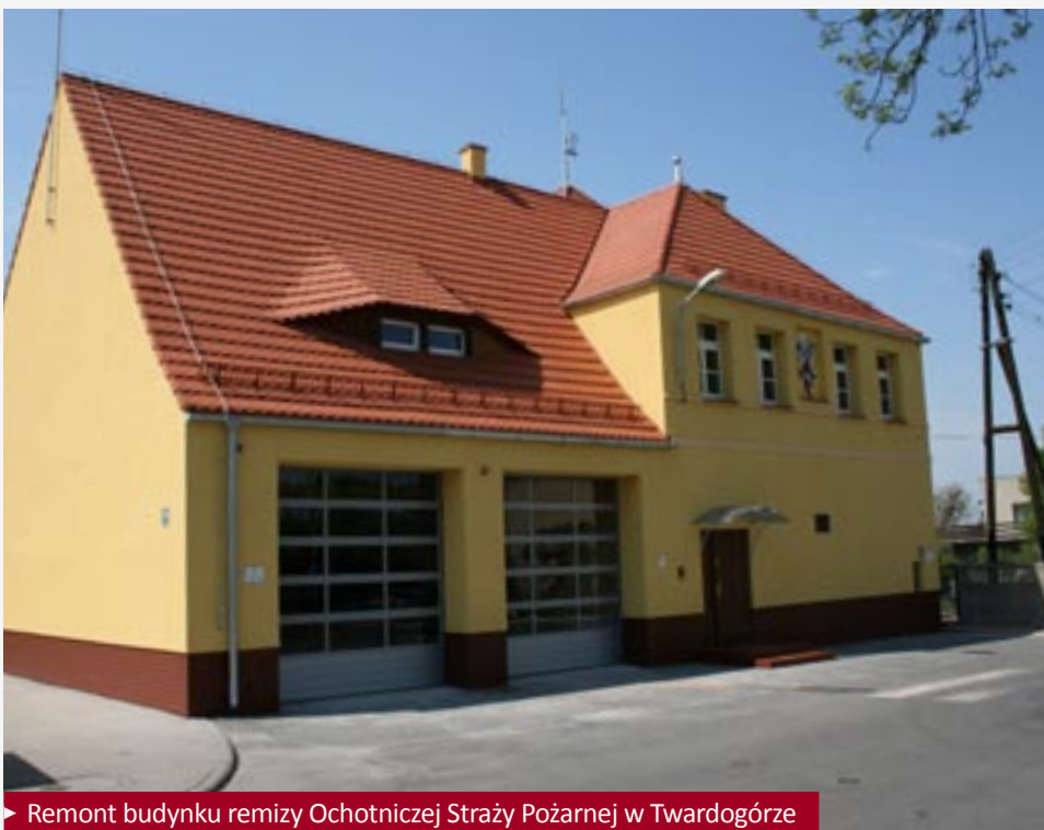
► Remont budynku remizy Ochotniczej Straży Pożarnej w Twardogórze