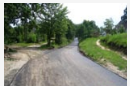
► Przebudowa drogi gminnej w Chełstowie