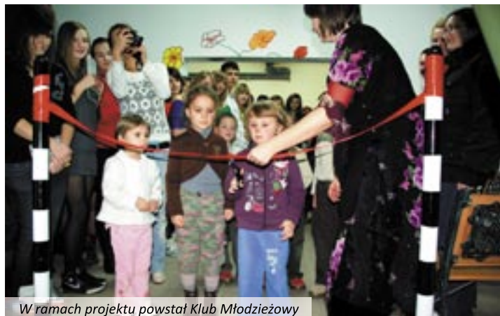
W ramach projektu powstał Klub Młodzieżowy

obozy i warsztaty survivalowe, warsztaty artystyczne w Bolesławowie, wyjazdy i spotkania edukacyjne, objazdowe festyny rodzinne, marsze na orientację, zajęcia strzelnictwa sportowego, s pływy kajakowe, rajdy rowerowe, występy i wystawy. Utworzono Klub Młodzieżowy „Wyskocz z