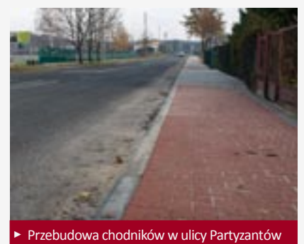
► Przebudowa chodników w ulicy Partyzantów