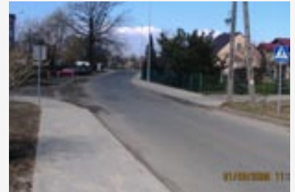
► Budowa chodników w Moszyczkach