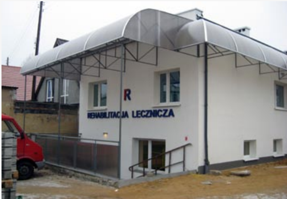
► Remont budynku usługowego przy ulicy Wielkopolskiej 11 w Twardogórze