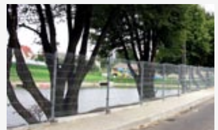
► Remont chodników i ogrodzenia wokół zbiornika rekreacyjnego i kąpieliska