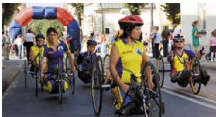
15. Międzynarodowy Bieg Uliczny o Puchar Przewodniczącego Rady Miejskiej w Twardogórze, odbył się 20 września