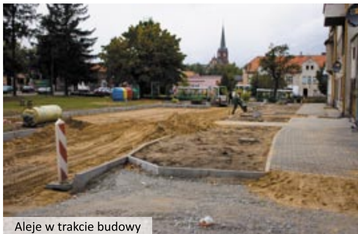
Aleje w trakcie budowy

jezdni i parkingu. Wcześniej wykonane zostało odwodnienie. Koszt inwestycji to 199 719,04 zł. Zakończenie prac przewidywane jest na koniec listopada.