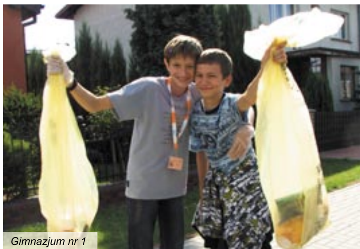
Gimnazjum nr 1