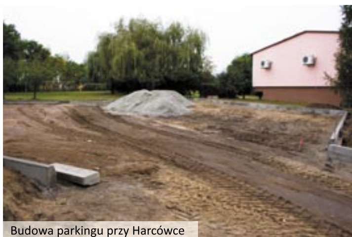
Budowa parkingu przy Harcówce