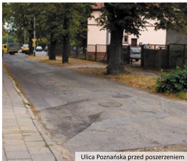
Ulica Poznańska przed poszerzeniem

ną lokalizacji kilku latarni. Przebudowane zostaną także chodniki. Droga ta stworzy możliwość objazdu centrum Twardogóry - przez ulicę Krzywą do Wrocławskiej. 5 października został przekazany plac budowy. Nowa asfaltowa nawierzchnia powinna pojawić się do końca listopada.