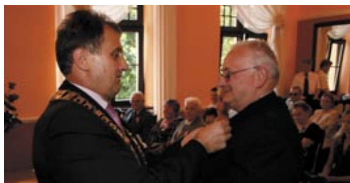
Uroczystość złotych godów, czyli 50-lecia pożycia małżeńskiego, odbyła się 10 września w twardogórskiej sali ślubów