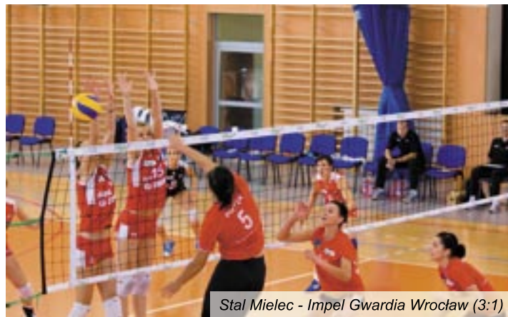
Stal Mielec - Impel Gwardia Wrocław (3:1)