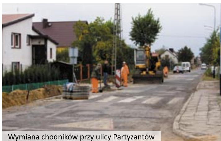
Wymiana chodników przy ulicy Partyzantów

czas na wykonanie nowej nawierzchni a także wewnętrznego parkingu przy świetlicy środowiskowej - Harcówce. Koszt przebudowy wyniesie 239 799,99 zł.