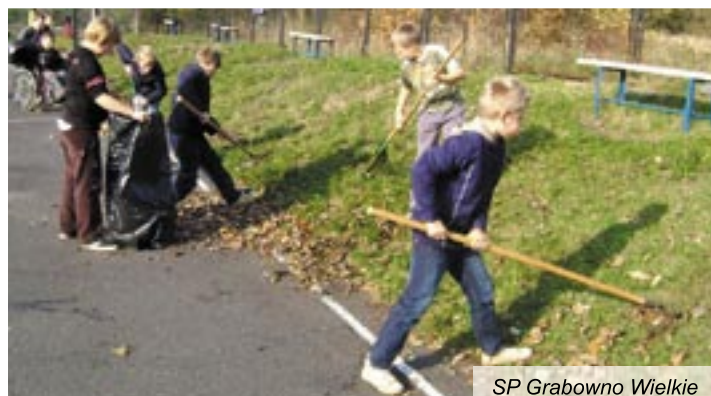
SP Grabowno Wielkie

worków, które po indywidualnym zgłoszeniu przez uczestników, wywiezione zostały przez Zakład Gospodarki Komunalnej i Mieszkaniowej. Łącznie do kontenerów trafiło 17 m sześć odpadów. Po zakończonym sprzątaniu, odpady zebrane selektywnie, służby komunalne dostarczyły do wybudowanej na składowisku hali na surowce wtórne, które następnie zostaną przekazane specjalistycznym firmom do ponownego wykorzystania. Pozostałe zmieszane odpady komunalne zostały zdeponowane na kwaterze gminnego składowiska odpadów innych niż niebezpieczne i obojętne w Grabownie Wielkim.