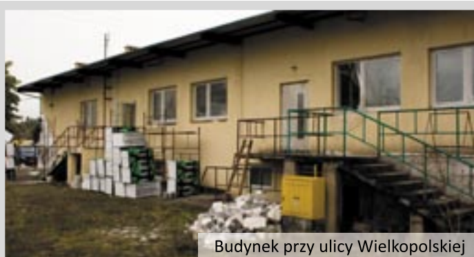
Budynek przy ulicy Wielkopolskiej

tem centralnego ogrzewania. Trwa docieplenie budynku w części wysokiej. Zmiany będą także wokół obiektu. Gmina przejęła część działki od SKR-u co umożliwi urządzenie ogrodzonego tarasu na zewnątrz budynku przy części restauracyjnej. Nasadzona zostanie również zielen. Od frontu natomiast powstanie nowy oświetlony parking. Inwestycja za 2 mln złotych potrwa do 20 listopada.