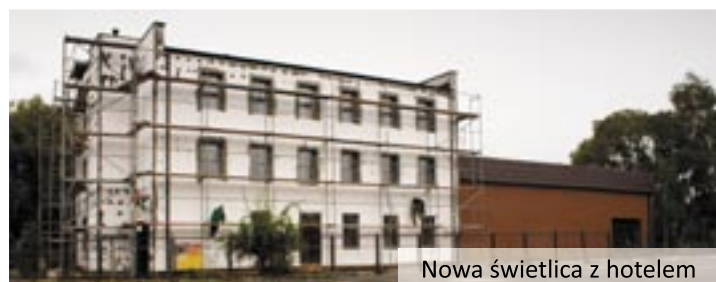
Nowa świetlica z hotelem

tralnego ogrzewania i elektryczne. Wyremontowane zostaną wejścia do budynku (główne i boczne) wraz z zadaszeniem, częściowo zostanie wymieniona stolarka drzwiowa oraz świetliki dachowe, zostanie ocieplona elewacja i zamontowane platformy dla niepełnosprawnych. Przy obiekcie zostanie wyłożony kostką wjazd i plac manewrowy. W pierwszej kolejności wykonywane są prace elewacyjne i dachowe. Remont potrwa do połowy grudnia.