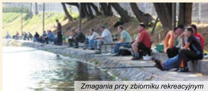
Zmagania przy zbiorniku rekreacyjnym

dal, łowienie rybek w baseniku itp. Za udział w różnego rodzaju grach i zabawach zostały rozdane nagrody za I, II i III miejsce. Zorganizowane też zostały warsztaty z origami – składano rybki, które później łowiono w „suchym basenie”. Malowano dzieciom twarze, odbył się także konkurs plastyczny na „najładniejszą rybkę”. Po warsztatach robienia kwiatów z bibuły, zaśpiewał męski zespół „CORD”.