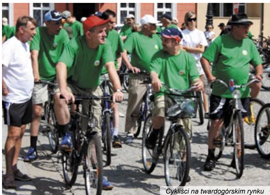
Cyklści na twardogórskim rynku