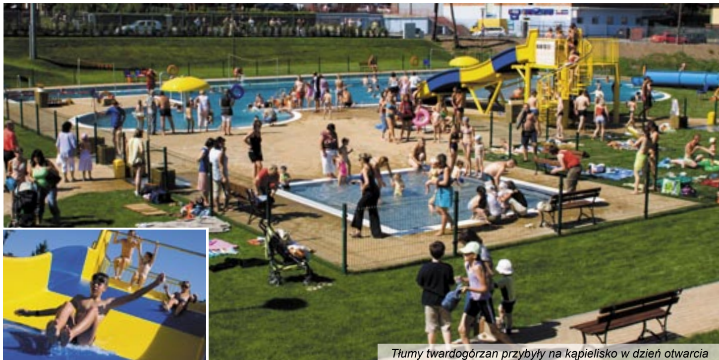
Tłumy twardogórzan przybyły na kąpielisko w dzień otwarcia

Otwarte kąpielisko to już trzeci, po hali przy ul. Wrocławskiej i kompleksie boisk Orlik-2012, duży obiekt sportowy oddany w ciągu niespełna roku w Twardogórze. Kosztował niemal tyle, co hala, bo około 9,5 mln zł. Na kompleks przy ul. Gdańskiej gmina pozyskała ponad 7 mln zł środków unijnych, pochodzących z Zintegrowanego Programu Operacyjnego Rozwoju Regionalnego.