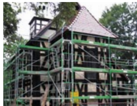
Projekt realizowany jest przy wsparciu urzędu marszałkowskiego województwa dolnośląskiego

łach - pomalowano cztery sale lekcyjne w Szkole Podstawowej w Grabownie Wielkim, klatki schodowe w Gimnazjum nr 1 i Szkole Podstawowej nr 2 w Twardogórze oraz dobiega końca re-