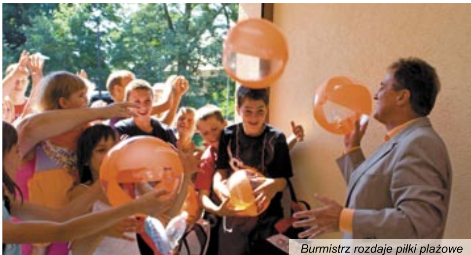
Burmistrz rozdaje piłki plażowe

W basenie pluskać się będzie można nie tylko w upały, ale i w mniej gorące dni. Dzięki kolektorom słonecznym woda jest podgrzewana, a jej temperatura nigdy nie spadnie poniżej 25 stopni. W przyległym brodziku jest jeszcze cieplejsza. Nieckę basenu o wymiarach 23,8 m x 39 m i głębokości od 1,2 m – 1,8 m wyposażono w wiele atrakcji, do których można zaliczyć: sztuczną rzekę, ławkę wielostanowiskową z masażem powietrznym, zjeżdżalnię rynnową o długości 37 m i kilkutorową zjeżdżalnię rodzinną, około dwadzieścia masażów wodnych, dwa grzybki wodne oraz dwanaście gejzerów powietrznych. Powierzchnia rekreacyjna basenu to 454