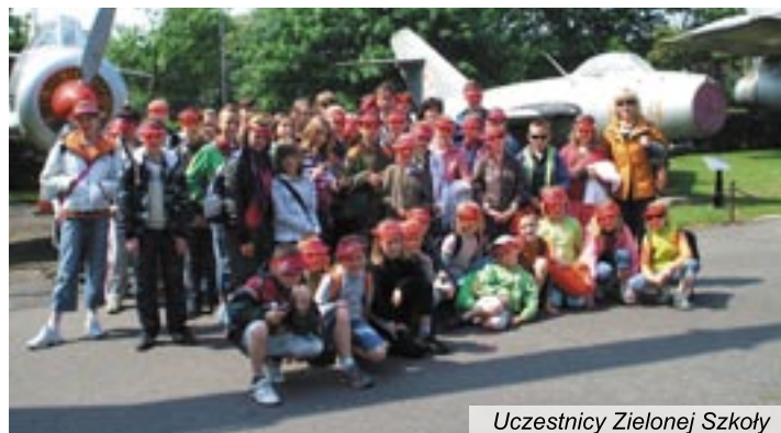
Uczestnicy Zielonej Szkoły

zwiedzali muzeum Orła Polskiego, katedrę i zobaczyli Pomnik Zaślubin z Morzem. Celem drugiej wycieczki był Woliński Park Narodowy. Uczniowie wzięli udział w szkoleniu wojskowym w Fordzie Gerharda, weszli na latarnię morską w Świnoujściu, płynęli promem, spacerowali Aleją Gwiazd oraz po moło w Międzyzdrojach. W Trzęsaczu widzieli ruiny kościoła i wzięli udział w lekcji w Muzeum Multimedialnym. We-