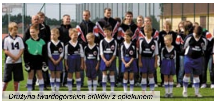
Drużyna twardogórskich orlików z opiekunem

cja inwestowania w sport prędzej czy później spowoduje, że energia, która tkwi w młodych ludziach, zostanie wykorzystana z pożytkiem dla ich zdrowia – swoimi refleksjami podzielił się z nami marszałek. Po przekazaniu wyrazów uznania przez kurator Beatę Pawłowicz przyszedł czas na symboliczne przecięcie wstęgi oraz część artystyczną. Umowę z wykonawcą boisk w ramach Orlika – firmą Prestige ze Szczecina, gmina Twardogóra podpisała 14 sierpnia. Koszt budowy wyniósł 1.085.344,42 zł. 333.000 zł z tej kwoty pochodziło z budżetu państwa, drugie 333.000 zł z budżetu województwa, resztę nakładów poniosła gmina.