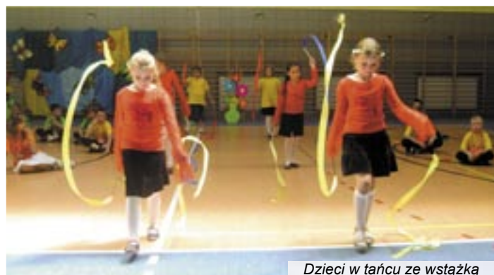
Dzieci w tańcu ze wstążką