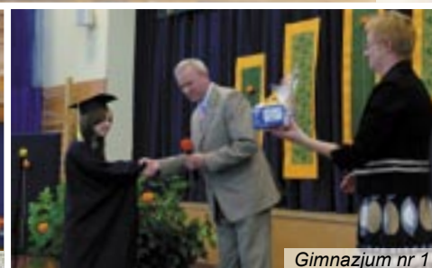
Gimnazjum nr 1