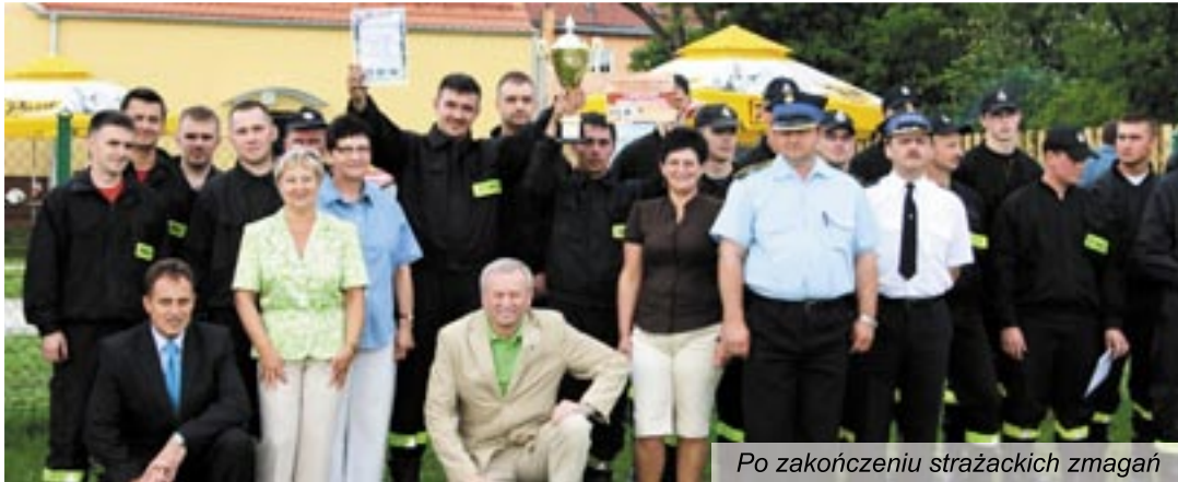
Po zakończeniu strażackich zmagani

Zawody sportowo-pożarnicze jednostek OSP Gminy Twardogóra odbyły się 20 czerwca. Rywalizowały drużyny z Twardogóry, Domaśławic, Grabowna Wielkiego oraz z zaprzyjaźnionej Kró-