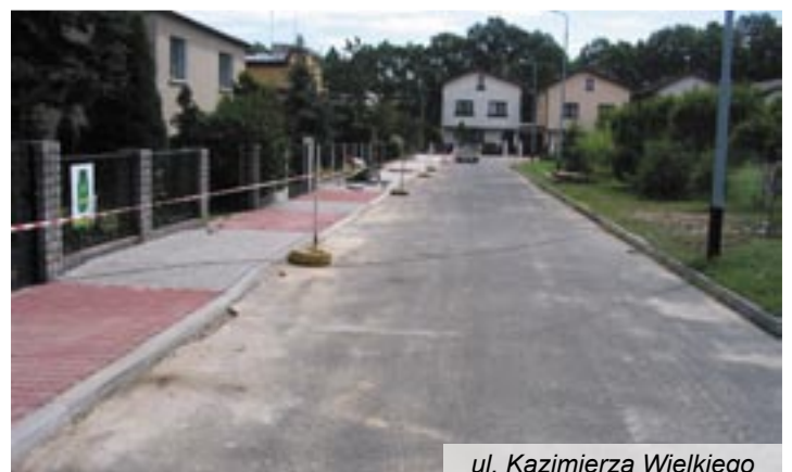
ul. Kazimierza Wielkiego

Wykonane zostały dokumentacje projektowe budowy chodników w ulicach Jagodowej, Malinowej i Borówkowej oraz budowy drogi w ulicy Kruczej.