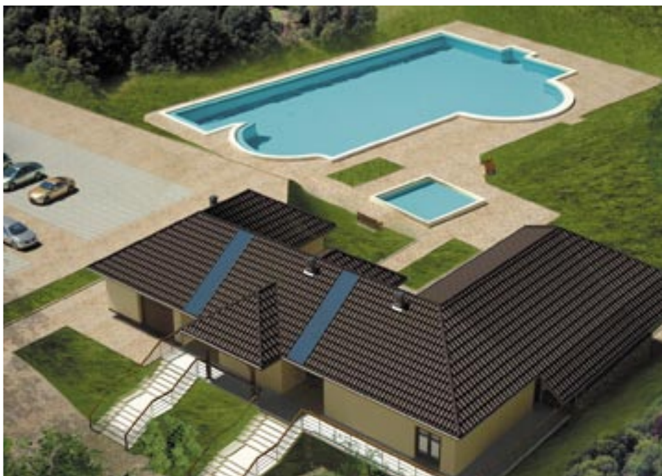
Wkrótce oficjalne przekazanie do użytkowania kąpieliska. Na koniec listopada planowane jest uruchomienie sztucznie mrożonego lodowiska - warunek to temperatura nie przekraczająca 10 stopni Celsjusza

Gmina Twardogóra podpisała umowy z Wojewodą Dolnośląskim o dofinansowanie ze środków unijnych następujących inwestycji: budowę kąpieliska otwartego wraz z budynkiem zaplecza w Twardogórze (wartość inwestycji 9 493 300 zł, dofinansowanie 7 088 620 zł); I etap przebudowy ulicy Dębowej i części ulicy Sportowej wraz z infrastrukturą techniczną w Twardogórze (wartość 1 256 140 zł, dofinansowanie 417 726 zł); przebudowę ulic Wołodyjowskiego, Zagłoby, Kmicica, Jagienki, Zbyszka i Wrocławskiej w Twardogórze (wartość 2 299 276 zł, dofinansowanie 1 724 457 zł).