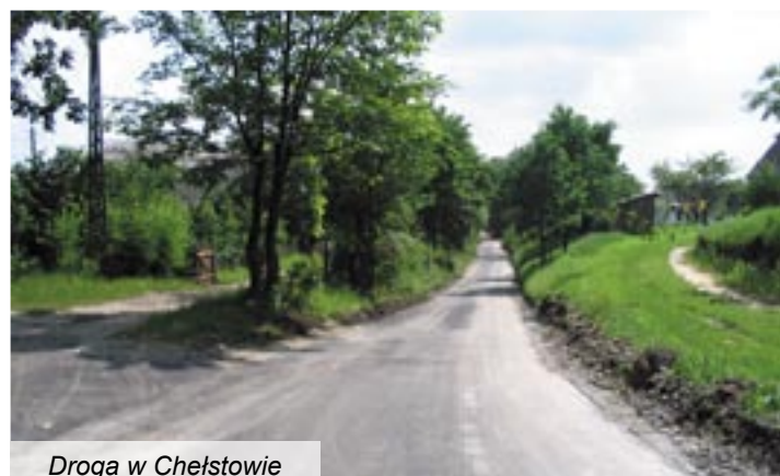
Droga w Chelstowie

Trwa budowa chodników przy ulicach Kazimierza Wielkiego, Władysława Łokietka, Bolesława Chrobrego, Władysława Warneńczyka w Twardogórze. Firma KAN-WOD powinna zakończyć prace do końca lipca.