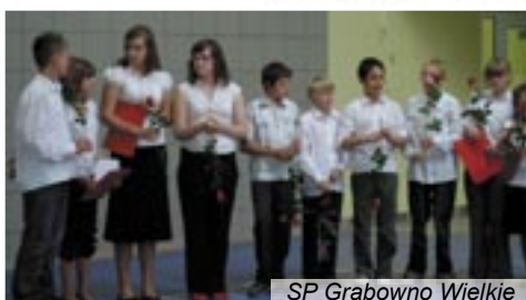
SP Grabowno Wielkie