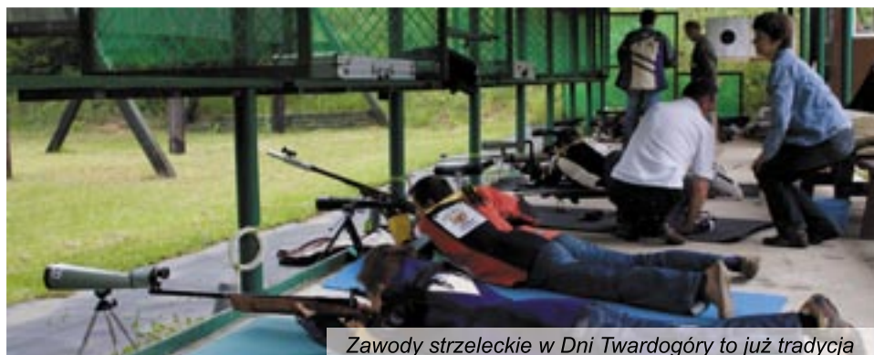
Zawody strzeleckie w Dni Twardogóry to już tradycja

W zawodach piłkarskich triumfowała SP nr 1, która w finale 2:0 pokonała SP nr 2. Po zwycięstwie 7:0 nad Sośniami na trzecim miejscu uplasował się Goszcz.