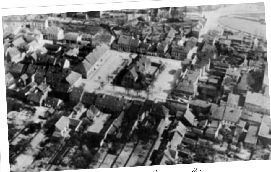
Twardogóra na starej fotografii