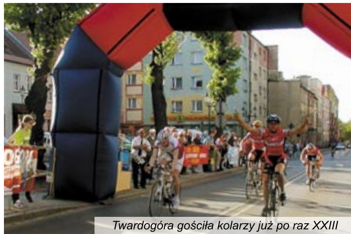
Twardogóra gościła kolarzy już po raz XXIII