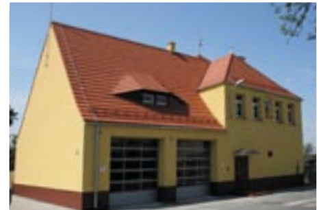
Remiza Ochotniczej Straży Pożarnej przed i po remoncie