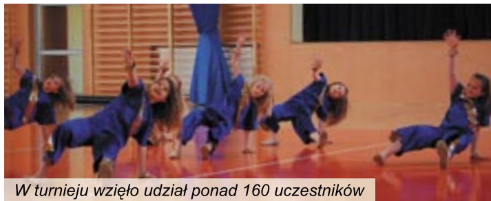
W turnieju wzięło udział ponad 160 uczestników