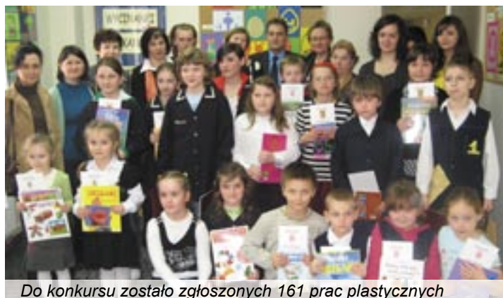
Do konkursu zostało zgłoszonych 161 prac plastycznych

Rozstrzygnięto konkurs plastyczny „Wycinanki wielkanocne”. Rozdanie nagród odbyło się 6 kwietnia w siedzibie organizatora – Biblioteki Publicznej Miasta i Gminy Twardogóra.