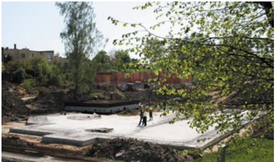
Płyta fundamentowa pod niecką kąpieliska została wykonana. W oddali widoczne ściany budynku administracyjno-szatniowego.