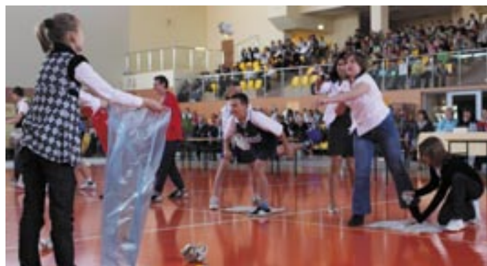
Uczniowie brali udział w konkurencjach sprawnościowych