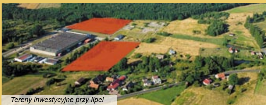
Tereny inwestycyjne przy Ilpei

Zmiany dotyczą istniejących podstref, a także utworzenia nowych, w tym podstrefy w Gminie Twardogóra obejmującej dwa kompleksy terenów w Chełstówku o łącznej powierzchni 4,39 ha.