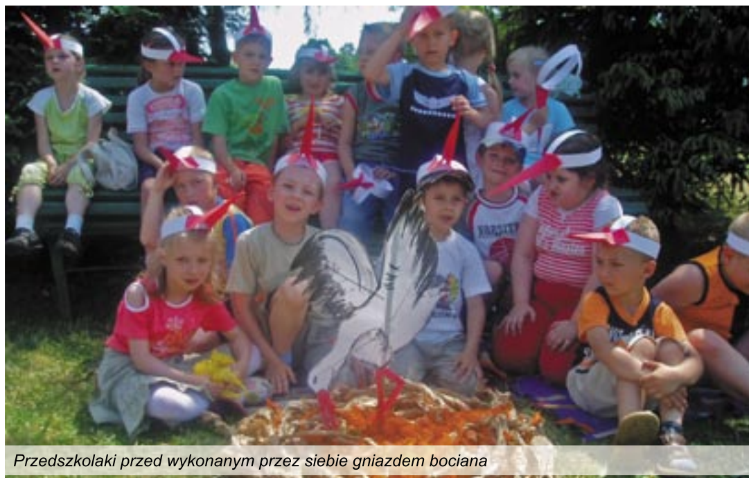
Przedszkolaki przed wykonanym przez siebie gniazdem bociana

Podczas wesołej zabawy na placu przed harcówką dzieci pracowały w zespołach podczas projektowania gniazda dla bociana Kajtka i jego żony. Wesołą zabawę umiły śpiewane przez nie piosenki związane tematycznie z bocianem. Najwięcej radości i śmiechu było podczas różnych konkurencji sprawnościowych. Mimo gorącej atmosfery, maluchy bardzo chętnie uczestniczyły w konkurencjach „Przeciąganie liny z bocianem”, „Żerujące bociany”, „Składanie jaj w gnieździe”. Ta niecodzienna zabawa dostarczyła wielu niezapomnianych przeżyć. Dzień Bociana Białego zostanie wpisany na stałe do kalendarza przedszkolnych imprez.