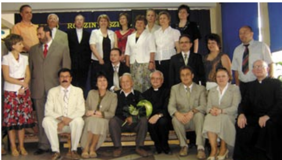
Pamiątkowe zdjęcie uczestników spotkania