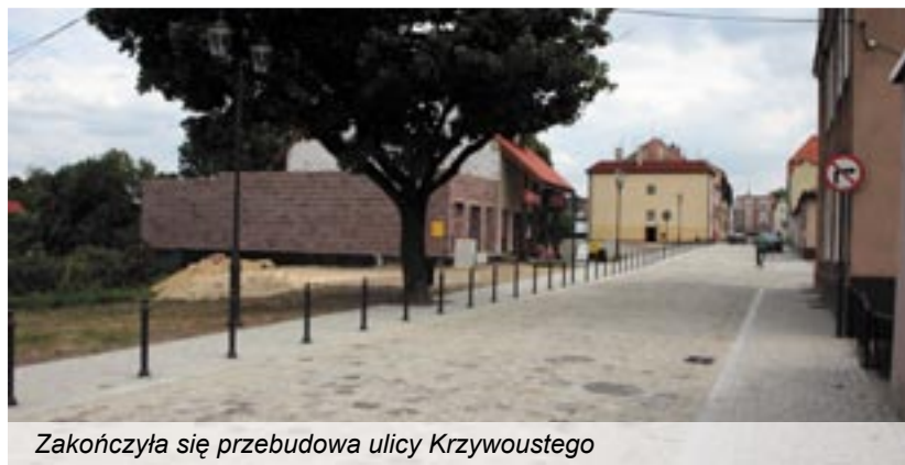
Zakończyła się przebudowa ulicy Krzywoustego